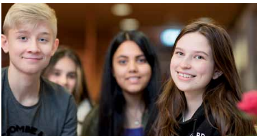
Velkommen som konfirmant i Tonsen kirke.