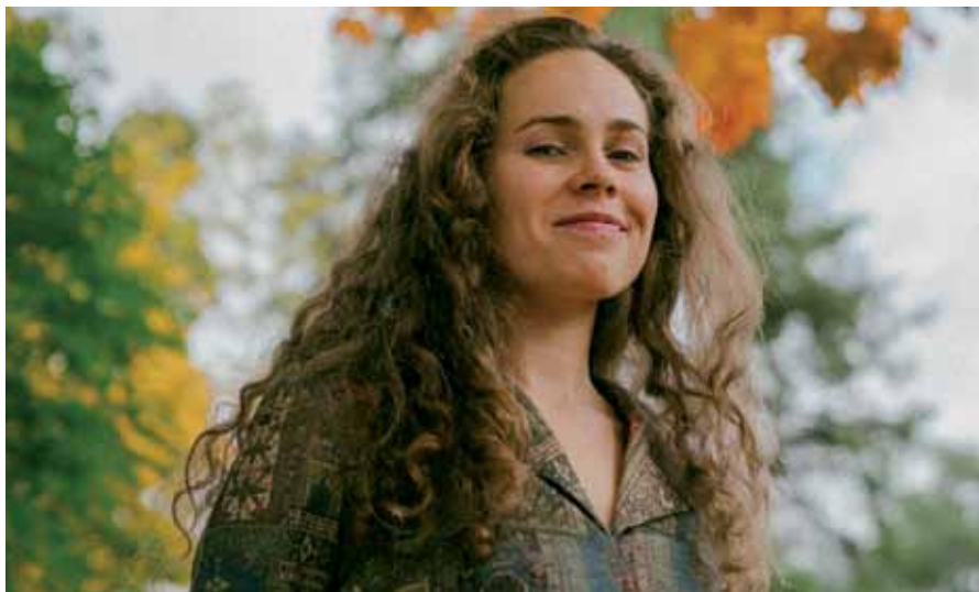
Tonsen er en menighet der det kommer barn til kirka hver uke.

– Jeg har hatt en 50% stilling som trosopplærer for barn i aldersgruppen 0-12 år. I tillegg har jeg vært dirigent for Superkidz og Tween Sing siste høst. Jeg synes det er gøy å formidle, og har fått gjort det både med bibelhistorier og sang. Høsttakkefesten i fjor, der toåringene var spesielt invitert, er sånn som jeg liker. Da brukte jeg de minste barna i Storsalen som prøvekaniner på fortellingen om Jesus som stiller stormen. Etterpå brukte jeg samme fortellingen i prekenen på høsttakkefesten i Tonsen.