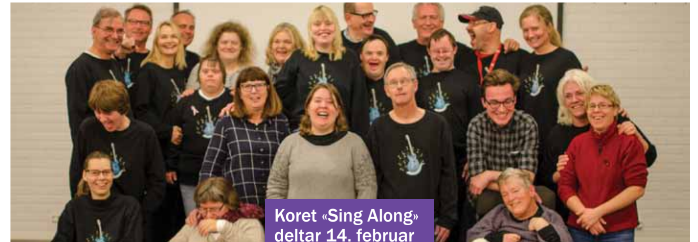
Koret «Sing Along» deltar 14. februar

Koret «Sing Along» og «Sing Along Kidz» er et musikalsk arbeid i Grefsen kirke for mennesker med ekstra behov. Den 14. februar har vi muligheten til å oppleve dem i Tonsen kirke, for da kommer de og deltar i gudstjenesten!