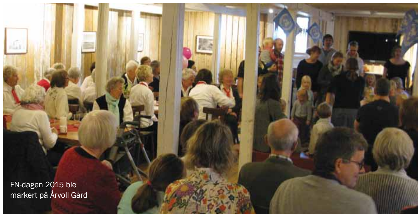
FN-dagen 2015 ble markert på Årvoll Gård