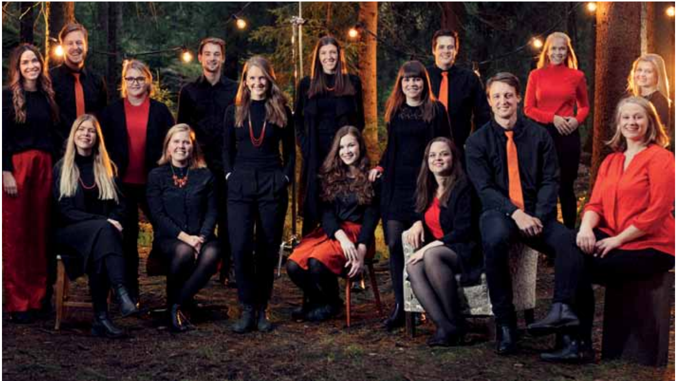
Koret Mosaic besøker Tonsen kirke og vil synge på gudstjenesten og på kirkekaffen 27. mai.