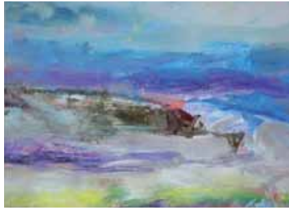
Maleri av Finn Harsem

Tilbudet er lokalisert i Østerdalsgata 7, i bydel Gamle Oslo. Vi har