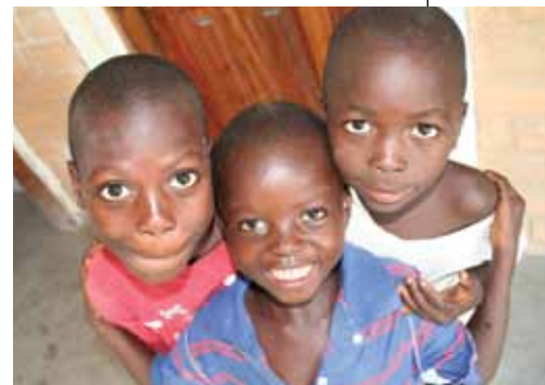
Misjonsalliansen samarbeider med Metodistkirken for sakte, men sikkert å bidra til gjenreisningen av Liberia.