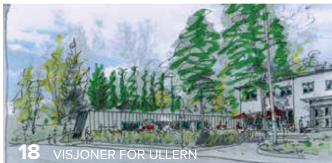
18 VISJONER FOR ULLERN