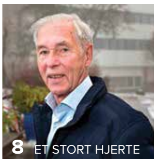
8 ET STORT HJERTE