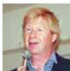
Av Stig Asplin

Skisser og muligheter vil bli presentert på et møte i menighetshuset torsdag 23.mars etter kveldsmessen i kirken kl.18:30.