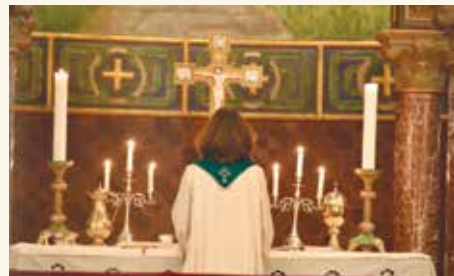
Ullern kirke er heldig og har mange fine tekstiler. Vi trenger noen til å ta vare på skattene.

”Drømmen min for Ullern menighet er at vi skal vokse og bli flere. At mange