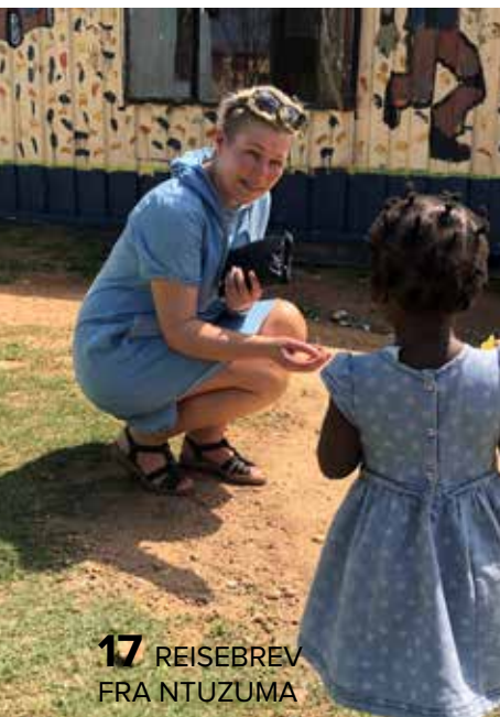
17 REISEBREV FRA NTUZUMA