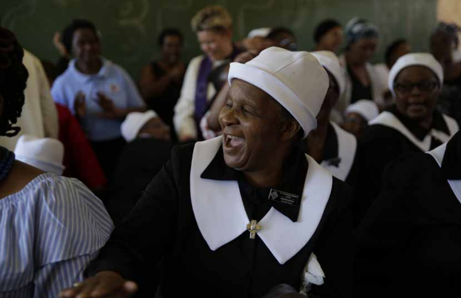
Gudstjeneste i klasserom og med for få stoler, er ingen hindring for lange og gode gudstjenester

Etter gudstjenesten ble vi invitert med på lunsj sammen med menighetsrådet i Ntuzuma. Da fikk vi en orientering om situasjonen der. Det har vært flere problemer, blant annet med prestene som er på vei ut av stillingen. De er blitt tildelt en ung kvinne som ny prest og det ser de frem til.