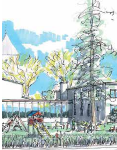
13 MENY HOLGERSLYST CAFE