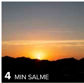
4 MIN SALME