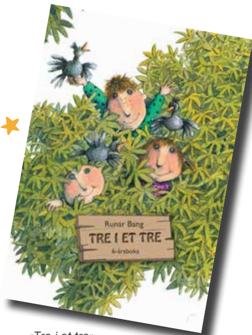
«Tre i et tre» (Runar Bang)

Gudstjenesten starter kl. 11.00. Vi setter pris på at alle som vil ha bok, møter opp kl. 10.30, slik at vi får registrert alle. Hold av datoen, invitasjon til alle som er døpt eller tilhørende i Ullern menighet kommer i posten om ikke lenge!