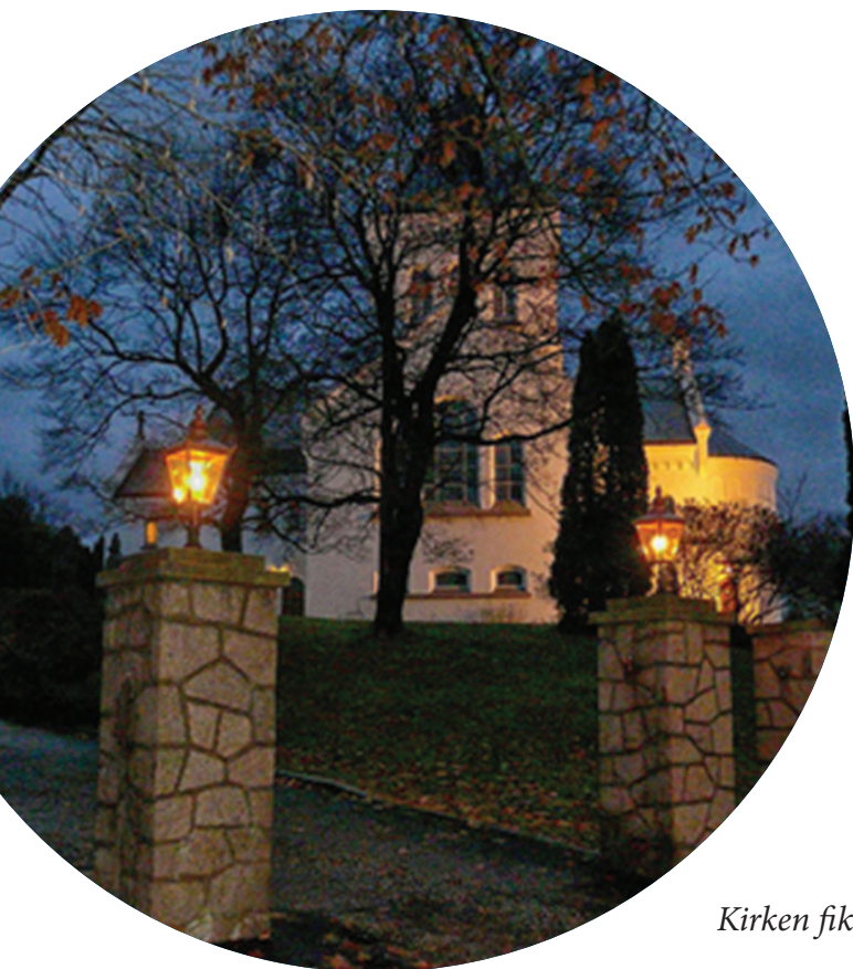
Kirken fikk i 2016 flott belysning på inngangsstolpene