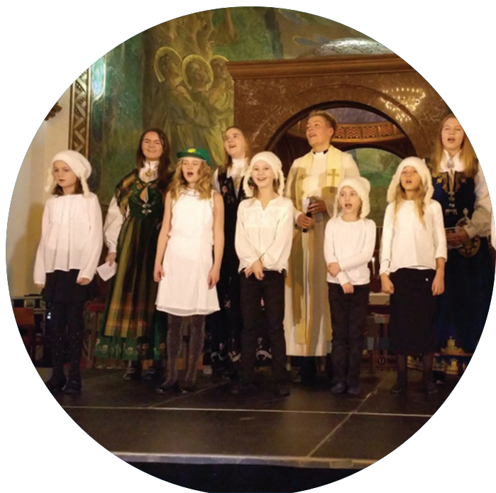
Barnas julegudstjeneste 2016