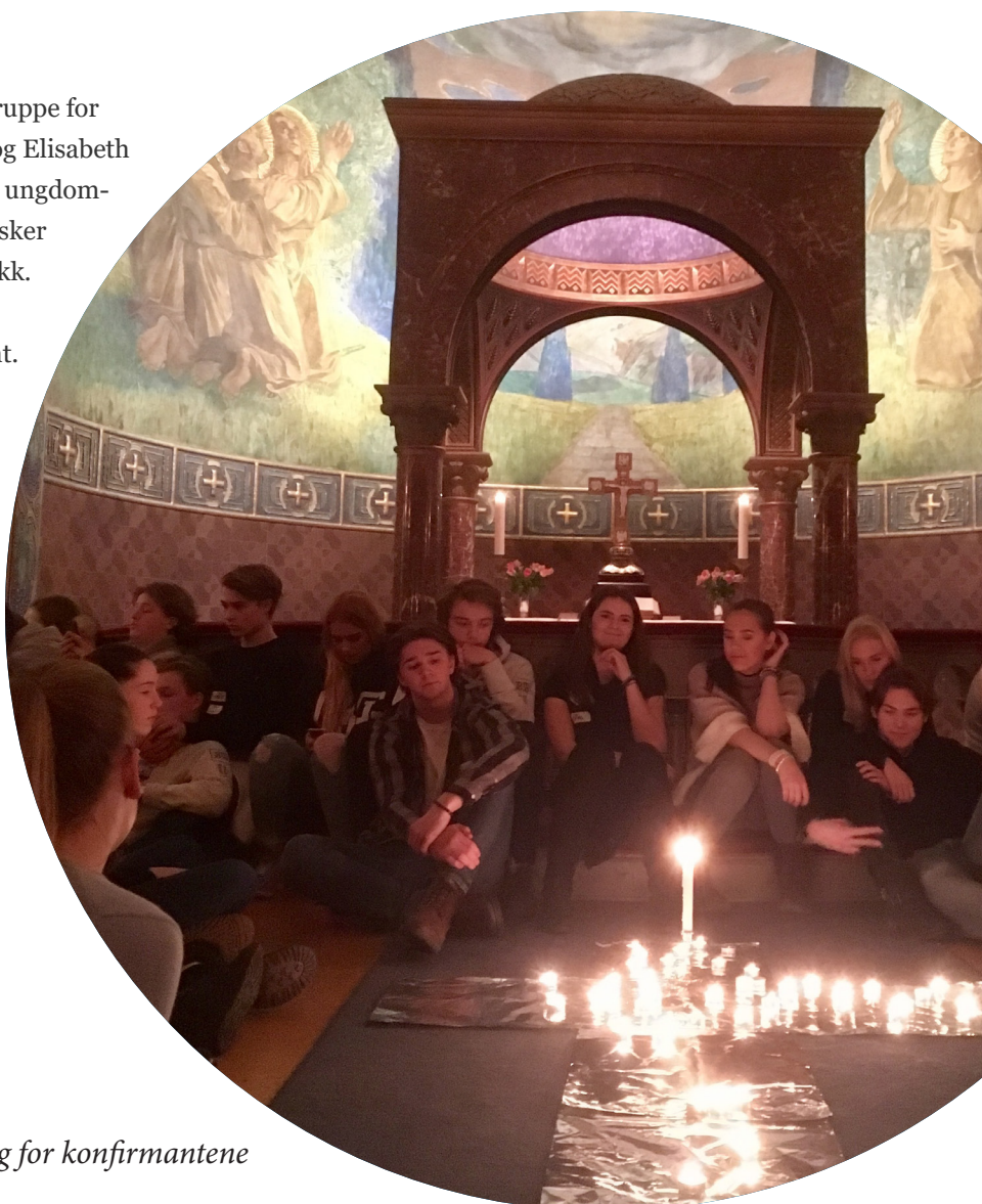
Bli kjent-helg for konfirmantene

Menigheten inviterer soknets barnehager til jule- og påskegudstjeneste. Det var 8 barnehager som deltok på påskegudstjenesten, og 8 (15) barnehager på julegudstjenesten.