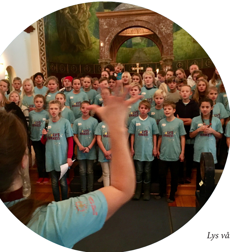
Lys våken 2016

Lys Våken, adventsnatt i kirken for 11-åringene, ble også i år avholdt i Ullern kirke. Det var i år hele 65 stk 11-åringene som deltok på dette arrangementet (mot 27 stk i 2015). Deltakerantallet har som nevnt doblet, og triplet, seg fra tidligere år. Dette er gledelig. Vi tror vi gjennom de siste årene har klart å bygge opp tiltaket, og skape et godt rykte. Ulike ungdomsledere var engasjert i både planlegging og gjennomføring av arrangementet. Arrangementet gikk fra lørdag kl. 15, og, etter overnatting i kirkerommet, varte til gudstjeneste 1. søndag i advent neste dag, der barna medvirket i gudstjenesten. Det var våkne vakter til stede gjennom hele natten.