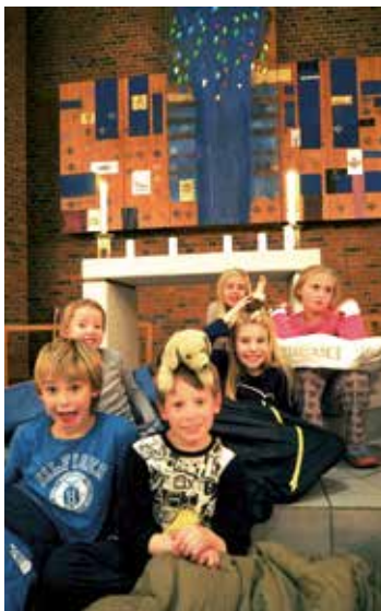
Klar til krype i soveposen på LysVåken!