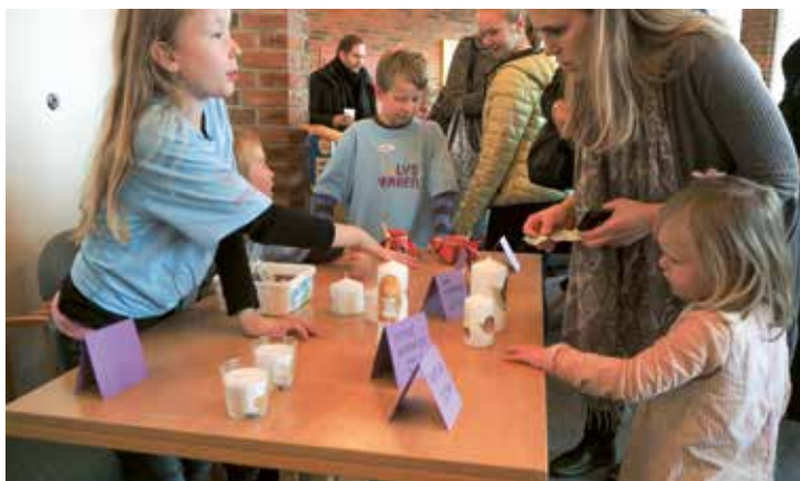
Salget av egneproduserte julepynt og godteri gikk unna på LysVåken.