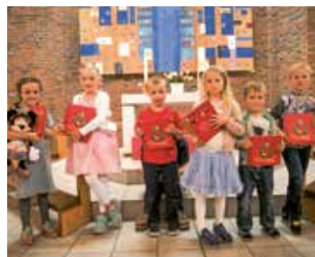
Førsteklassingene fikk 6-årsbok ved skolestart.