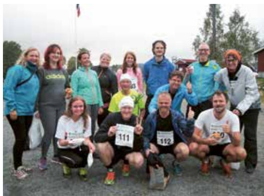
Stabene i Røa og Voksen menighet møttes til edel kappestrid i høstens Sørkedalsløp.