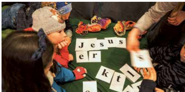
Barna leter etter løsningsordet på påskemysteriet (Tårnagenthelg).