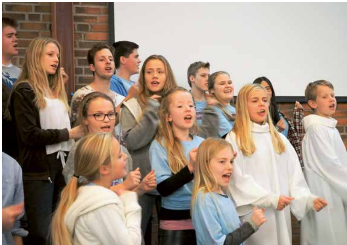
LysVåken koret i full sving med sangen «Det sanne lys» på gudstjenesten.

Dette var et glimt fra trosopplæringen som vi har jobbet med de siste 2 årene i Voksen menighet. Barna skal få årlige invitasjoner til ulike arrangementer. Det starter med dåp og babysang, via 2-4-6 års bøker, tårnagenthelg og LysVåken. Så er det konfirmasjon, ledertrening før vi runder av med solidaritetsløp for 17-18 åringene. De fleste tiltakene er knyttet opp til en gudstjeneste og kan gi et løft til