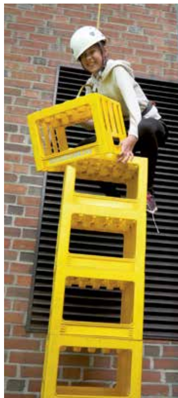
Bruskassekltring på Til topps for 7.-klassinger.