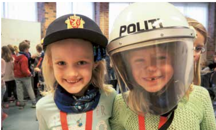
Politiet besøkte oss på Tårnagenthelg i år.