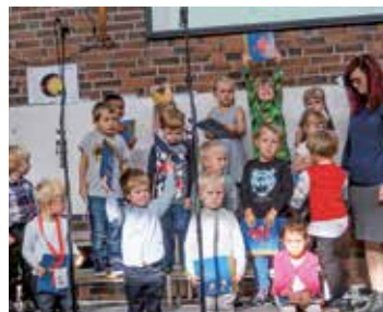
Stolte 4-åringene som har fått hver sin kirkebok i høst!

Vi fikk i oppgave å utarbeide en egen plan for Voksen menighet med utgangspunkt i den nasjonale planen: «Gud gir- Vi deler.» Styringsgruppen og trosopplæringsleder har jobbet fortløpende for å lage en best mulig plan for Voksen menighet. Alle som er involvert i barne- og ungdomsarbeidet i menigheten, har kommet med innspill og bidratt på