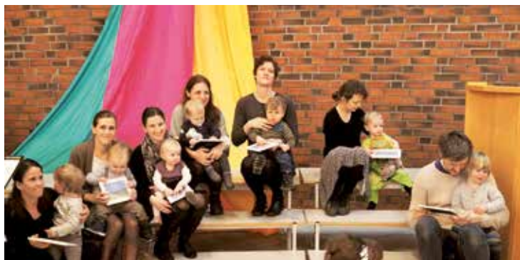
2-åringene får utdelt innrammede kveldsbønner.