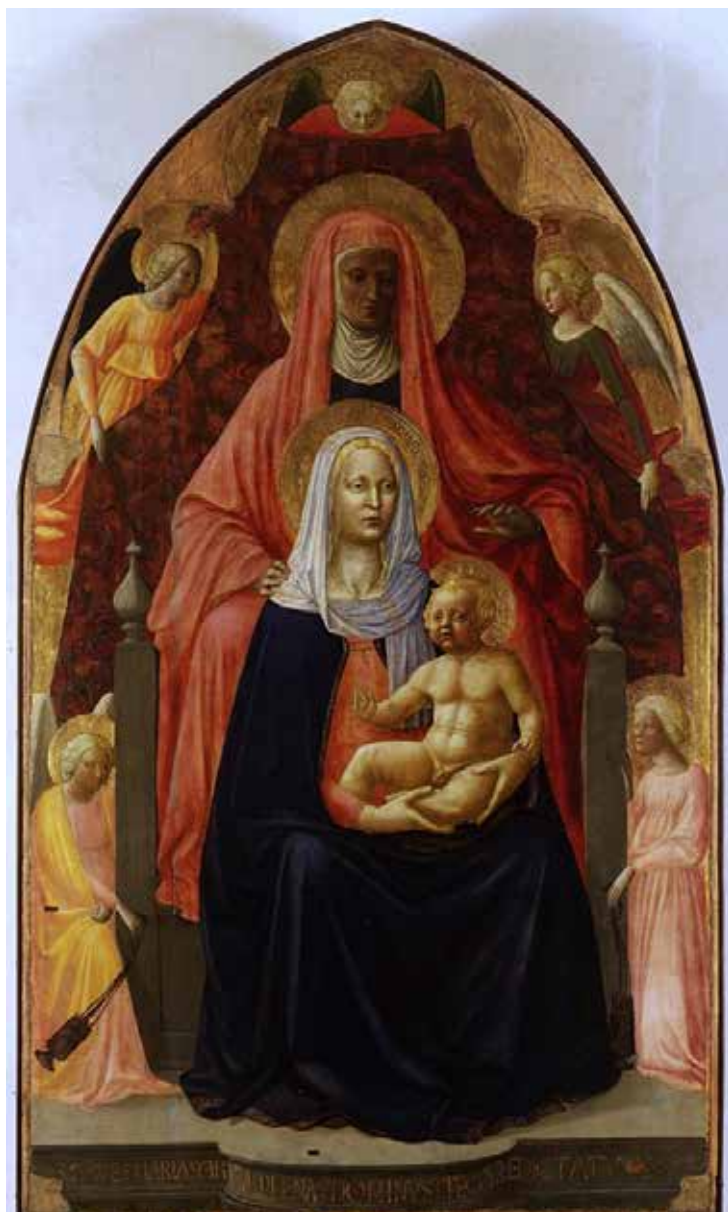
Maria med Jesus og Anna av Masolino og Masaccio.

Maria ble følgelig trolovet med tømmermannen Josef fra Nasaret, som var av Davids