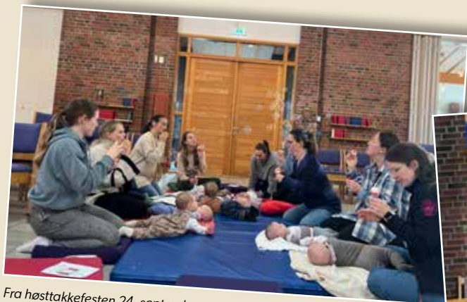
Fra høsttakkefesten 24. september