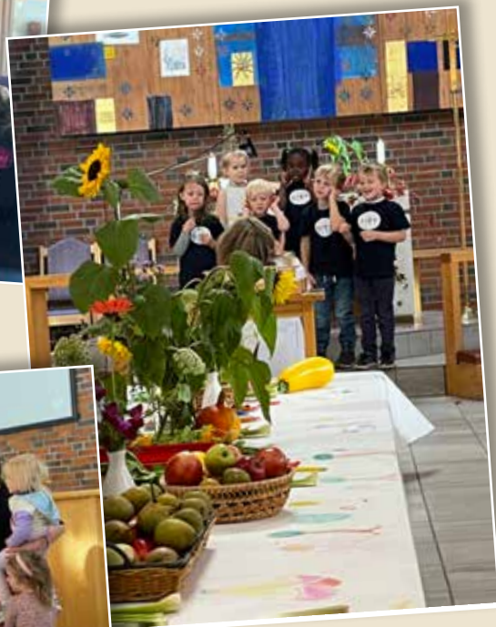
Utdeling av barnas kirkebøker 24. september