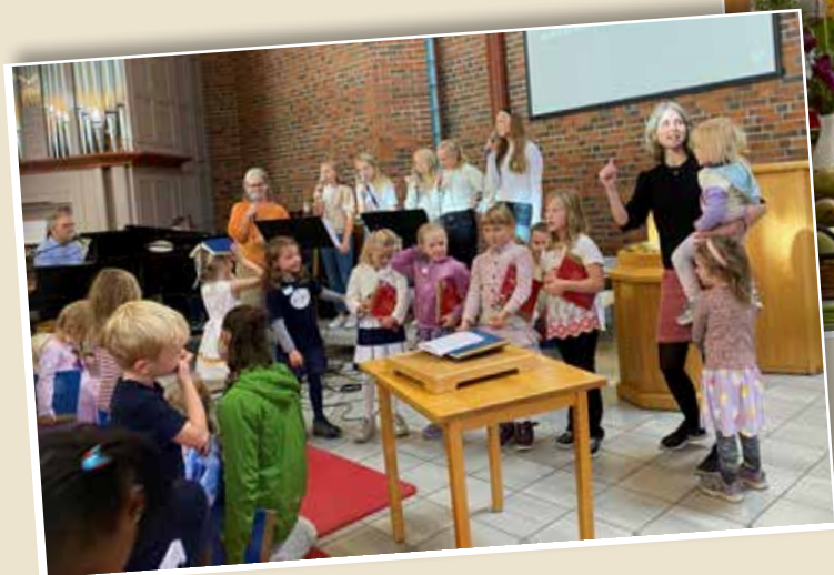
Såpebobler på babysang i kirken