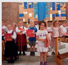
fra 6-års gudstjeneste