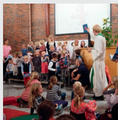
fra 4-års gudstjeneste

28-29 nov. overnattet en gjeng spente 10 og 11-åringer i kirken!