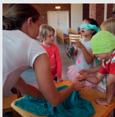
fra 4. års samling