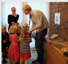
fra 6- årsboksamling

7- åringer inviteres spesielt til å lære mer om det som skjedde i julen. Onsdag 16.12 kl. 17-19: Juleverksted og øvelse på årets julespill som fremføres på julaften kl. 14. Alle får invitasjon i posten.