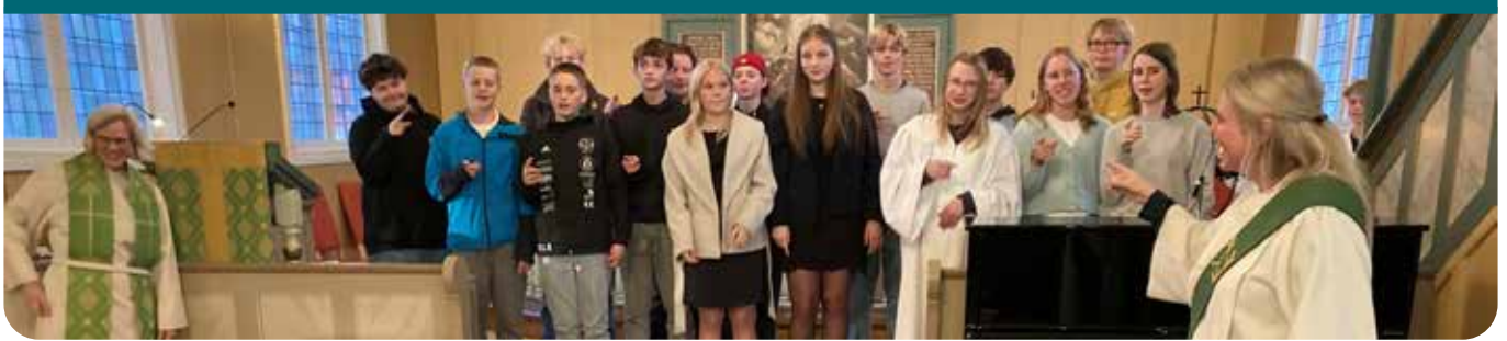
Konfirmantene bidro under gudstjenesten.

Torsdag 24. oktober møttes unge og gamle til den årlige generasjonsgudstjenesten med etterfølgende hyggelig samvær i kirkestua. Dette er en tradisjon mange setter stor pris på og som hvert år samler mye folk. Slik var det også i år.