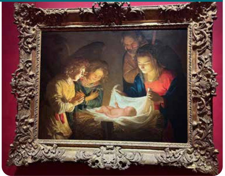
Adoration of the Child av Gerrit van Honthorst avfotografert fra Uffizigalleriet i Firenze

Ordet skapte lyset i skapelsens morgen. Gud sa: «Det bli lys.» Og det ble lys! Dette Ordet fødes på ny og blir lys som lyser i mørket, ja, som lyser for hvert menneske. På