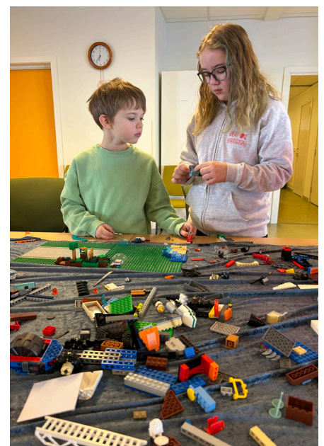
Mange muligheter ved legobordet