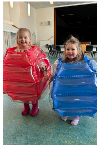
Boblefotball var populært