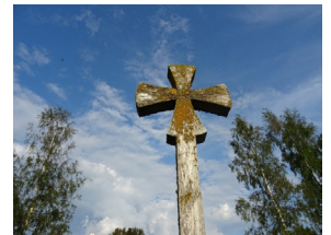
Korset ved Dystealteret.

Ta gjerne med nistekurv, og noe å sitte på.