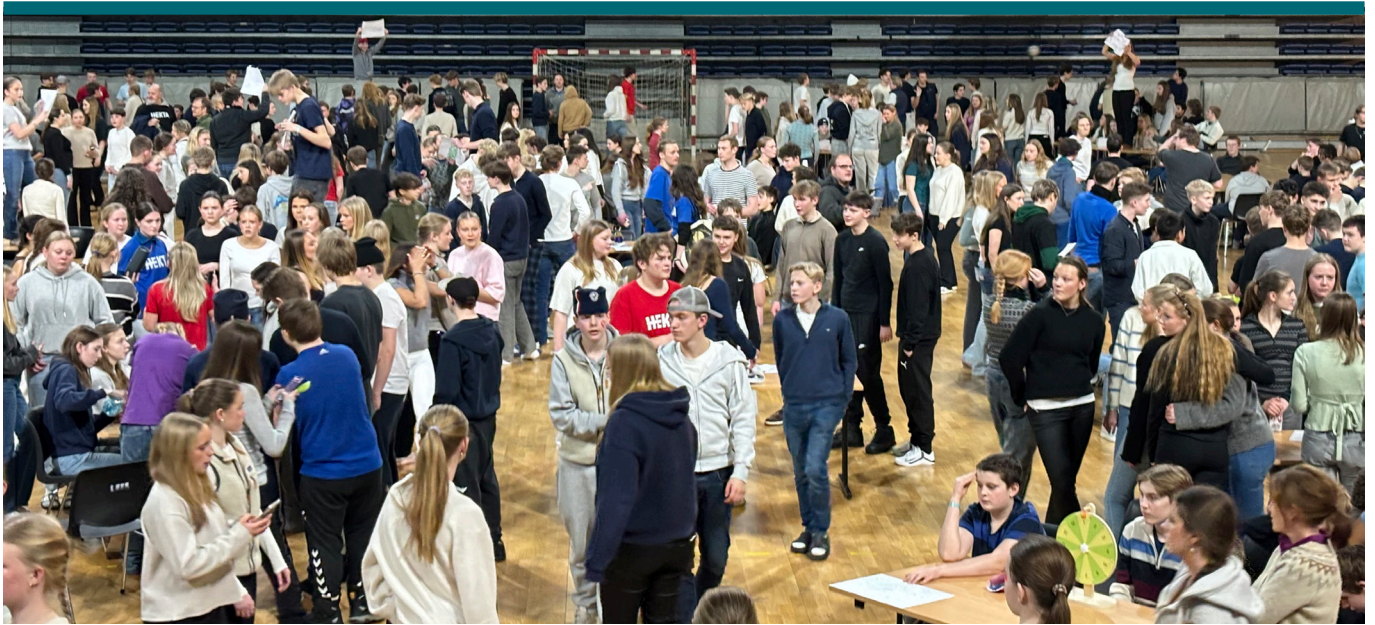
Globalmarked