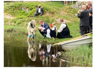
Dåp i Lønsjøen.

Tips: Det er anledning til dåp i Lønsjøen denne dagen!