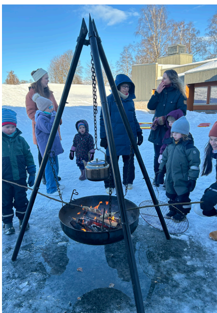
Pinnebrød og bålkos