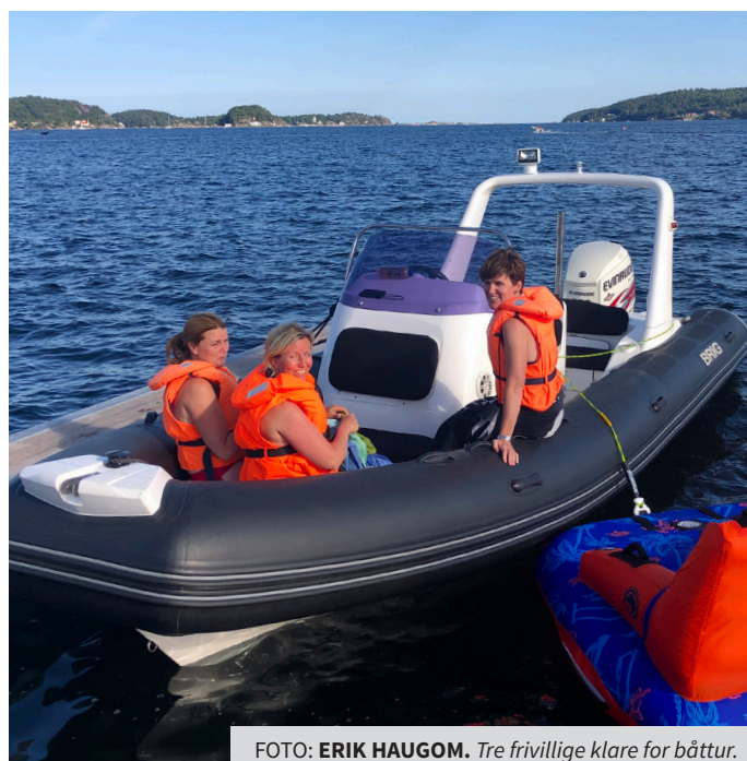
Tre frivillige klare for båtturen.