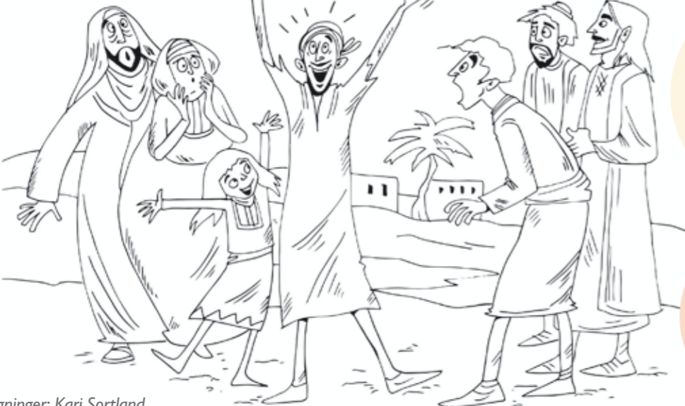
Tegninger: Kari Sortland

Bartimeus var blind. Da Jesus kom forbi, ropte Bartimeus til ham, og Jesus ga ham synet tilbake.