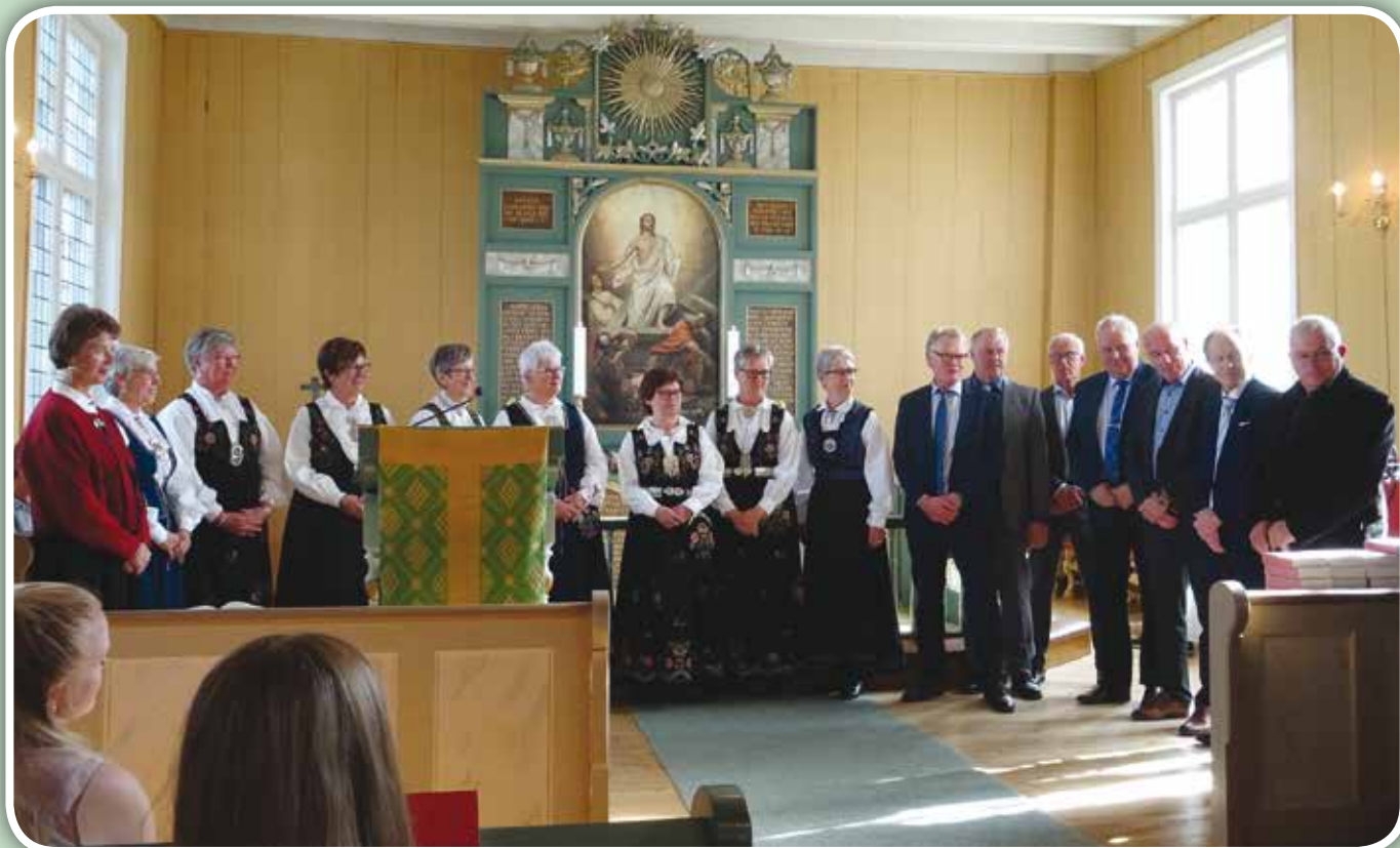
Gullkonfirmantene ble feiret 15. september.