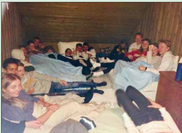
Konfirmantene i loftskroken.