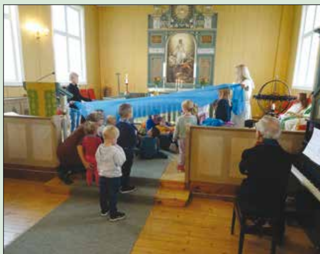
4-åringene bidro under gudstjenesten.