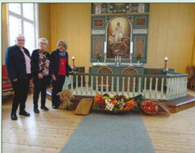
Bygdevinnelaget pyntet kirken med markens røde.

Høsttakkefesten ble feiret 13.oktober og her kommer noen glimt derfra: