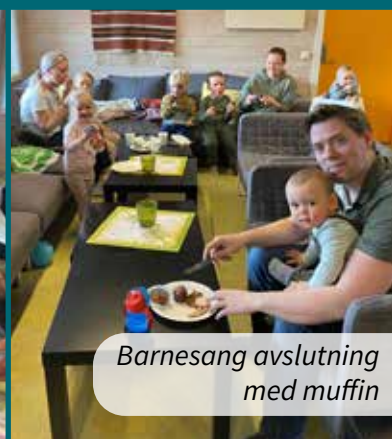
Barnesang avslutning med muffin