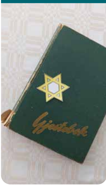
Bare et navn

Vi hadde ei gjestebok. Den ble nok ikke tatt fram «i tide og utide» når vi hadde besøk. Faktisk mindre enn ti ganger i løpet av årene 1958-1969 da far - for andre gang - var prest i Kolbu og Eina. Men én dato og en kort hilsen i boka ble spesielt viktig for meg: