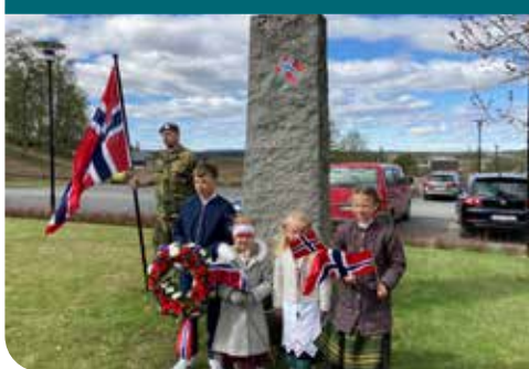
Kransenedleggelse ved Kolbu kirke til minne om falne under 2. verdenskrig av elever fra Totten Montessoriskole.