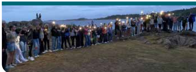
Østre Toten konfirmantene synger «du må tenkje sjøl» av Trond Viggo Torgersen