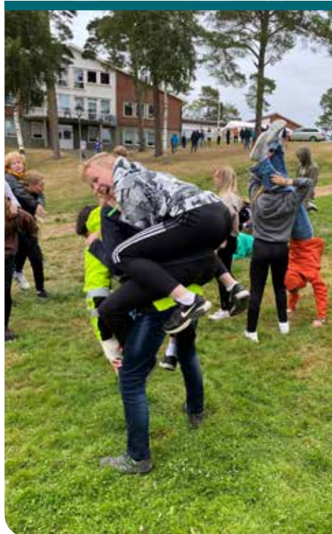
Hvis noen lurer, slik ser det ut når ungdom skal bli kjent. Glede, lek og moro!