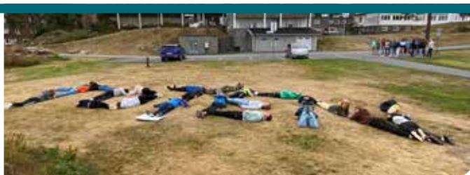
Konfirmantleir på Drottningborg i Grimstad. Ungdommene bruker seg selv som bokstaver: TOTEN