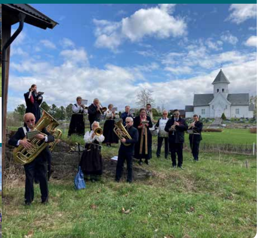
Kolbu Janitsjarkorps bidro med musikk på mange forskjellige steder i bygda. Her spiller de barnetoget opp til kirka.