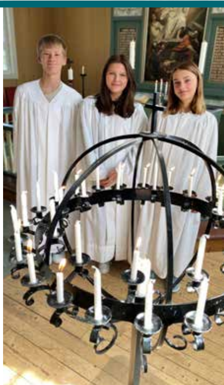
Takk for alt dere har gjort som ministranter! Vi setter så stor pris på dere:)