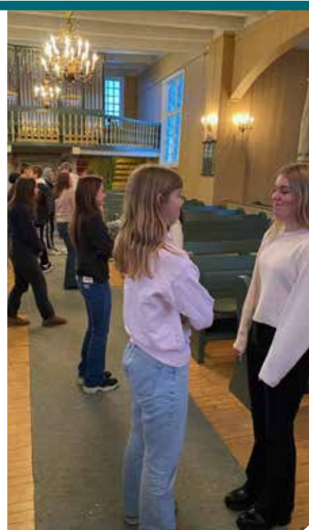
Grensesettings øvelser. For seg selv og andre. Hvor nært er greit for meg? Hvordan ser andres kroppsspråket ut når vi kommer noen for nær? Jesus satte grenser for seg selv og andre. Det er godt å ha et forbilde fra bibelen.