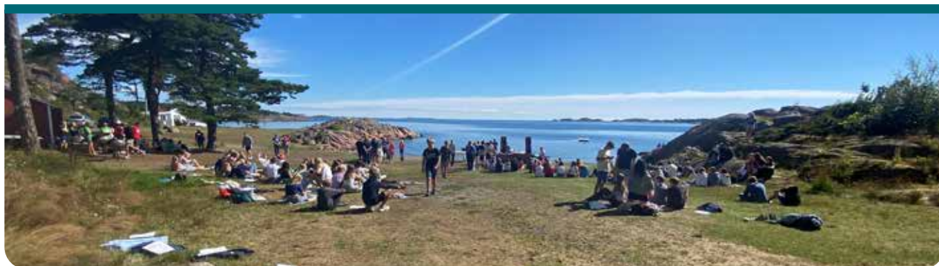
Avslutning på leiren; utegudstjeneste ved vannkanten. Idyll!