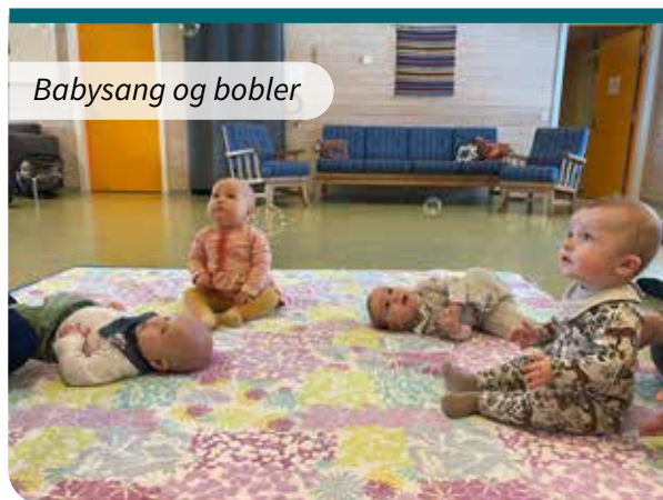
Babysang og bobler

Søndag 18. juni kl 11 blir det friluftsgudstjeneste ved Lønsjøen. Flere barn skal døpes i sjøen. Ønsker du også å bli døpt denne dagen, så ta kontakt med menighetskontoret! Ta gjerne med nistemat og noe å sitte på!