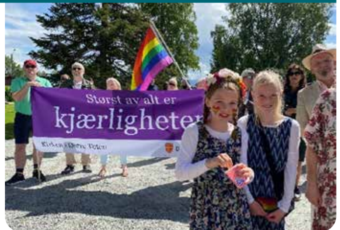
Bilde fra Østre Toten sin første Pride parade, i juni 2022. Kirka hadde ordnet banner med ordene; 'Størst av alt er kjærligheten'.