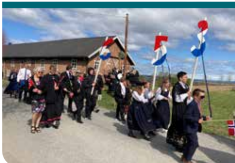
Barnetoget på vei mot kirken.