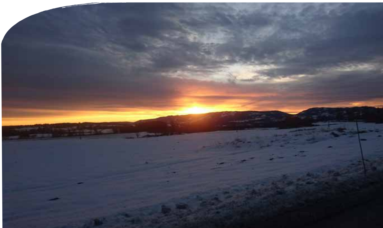
Soloppgang over Totenåsen, sett fra Tømmerholshøgda