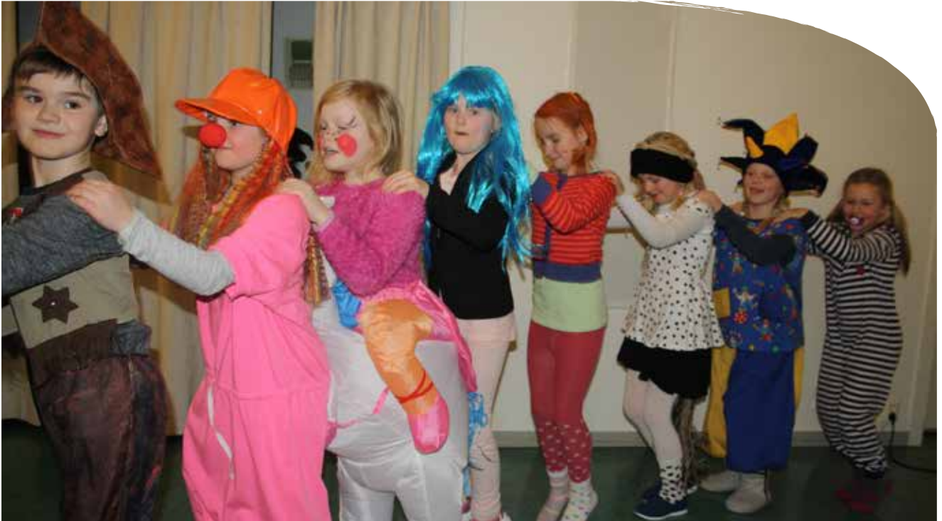
Karnevalshelg i Bygdestua 25. – 26. februar. Godt ledet av dyktige ungdommer.