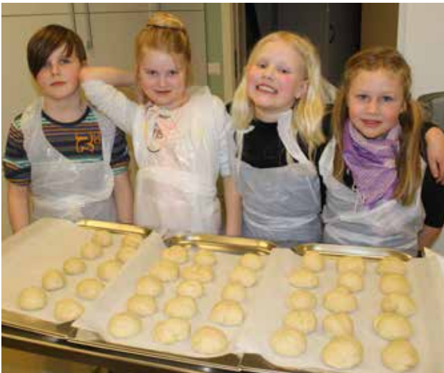
Stolte bollebakere. Bollene ble servert på kirkekaffen etter gudstjenesten på søndag.