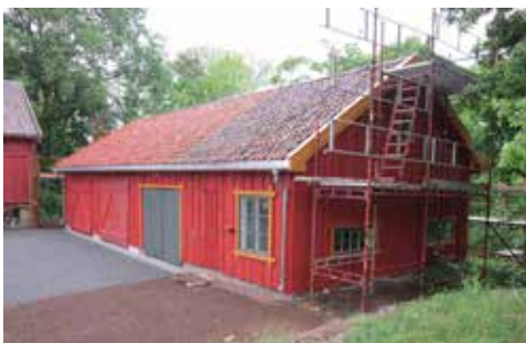
Bilde 1

Det har vorti travle dagar for snekkarane i Prestegarden i vår òg. Nå er det garasjen som har vorti fornya. Den vestre, lafta delen av huset er teki ned og erstatta med svært solid bindingsverk. Sidan 1937 har den delen vorti brukt som garasje. Den austre delen, der det har vorti hønehus, har ikkje snekkarane gjort noko med. Under garasjedelen er det støypt ny grunnmur. Den gamle panelinga har komi på plass att, og huset er måla og har fått nytt tak.