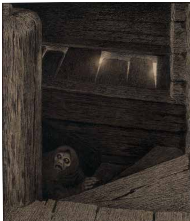
Pesta i trappa, Nasjonalmuseet

Utover på 15- og 1600-talet tok folketalet tæll å vækse. Mange ta dei gardom som hadde vørti lagt øyde etter Svartedauda, kom det folk på att. Rundt 1710, omtrent 360 år etter at pæsten kom, var det like my' folk på bygden som det hadde vøri føre Svartedauden.