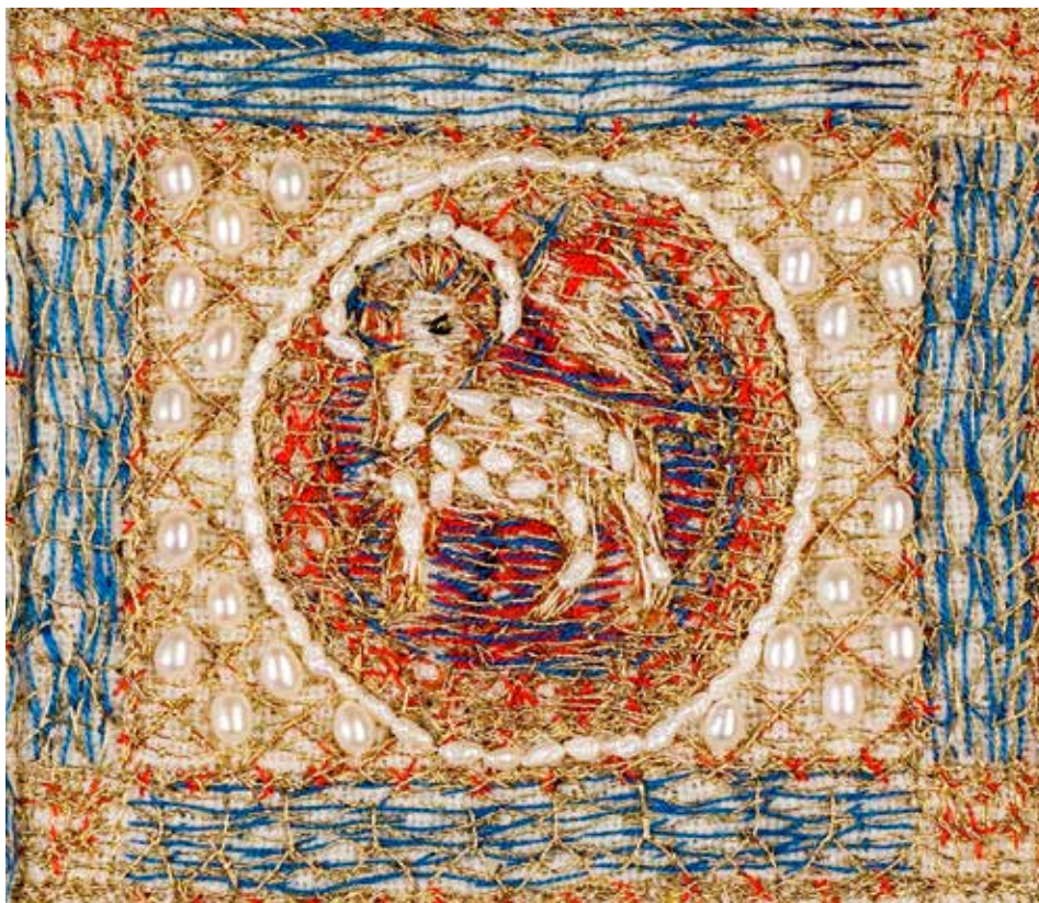
Bildet er fra bispekåpa til Hamar biskop. Motivet er Guds lam framstilt som den seirende Kristus, bærende på korsfanen – seiersfanen. Symbolet sitter på den minste delen av bispekåpa – på spennet foran som holder kåpa sammen. Guds lam er ett av kristendommens sterkeste symboler.

Jesus er ikke i graven. Han er stått opp. Han er her, fordi vi er her.