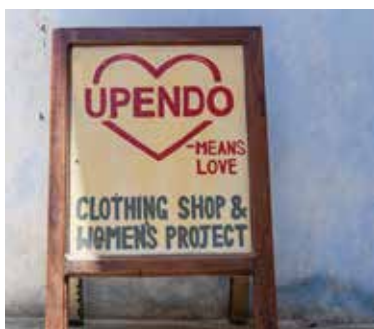
Kirkens Nødhjelp støtter Upendo House på Zanzibar. Her får unge jenter som har opplevd urett muligheten for å ta syutdannelse med særlig fokus på å kunne jobbe som «sin egen sjef». Upendo betyr kjærlighet.