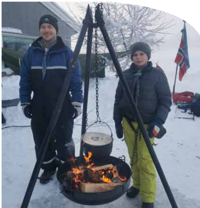
Godt å varme seg ved bålpanna til speiderne.