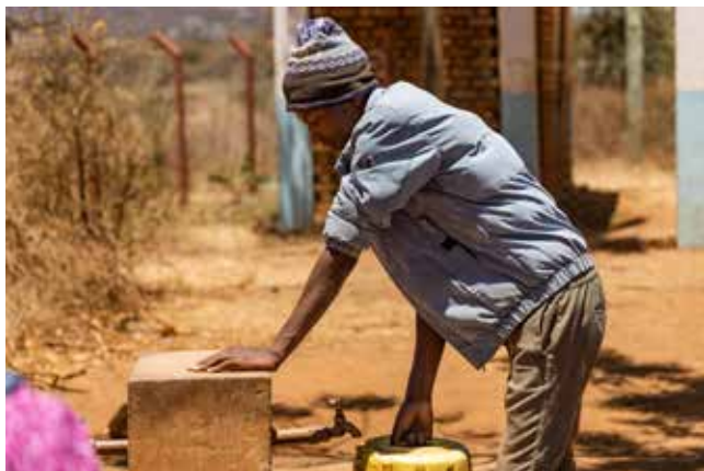
Brønn satt opp i landsbyen Goje i Tanzania.