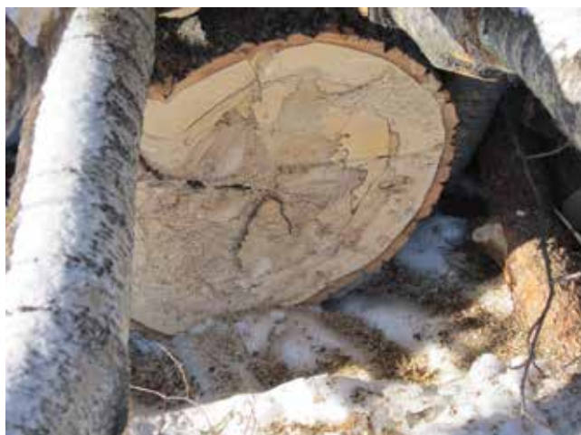
Det vart hoggi tre ved Hoffkjørkja og Kappkjørkja i vinter. På ein del av trea var rotningsprosessen i gang