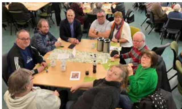
Gjengen fra Onsdagskaféen i prat med den kommende biskopen under kirkekaffen.

Vi takker for alvoret, varmen og gleden han formidlet, og ser fram til å møte ham igjen som vår biskop.