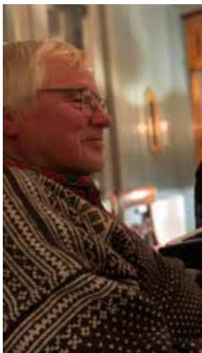
Olaf avbildet på boksleppet.

Ordføreren vår er og bonde på Fodstad, nabogård til Øvre Evang og til Prestegården. Bror sa i sin hilsning at det var spennende å lese om alle dei småveiene og gardene rundt omkring som han gjennom årene hadde kjørt med hest.