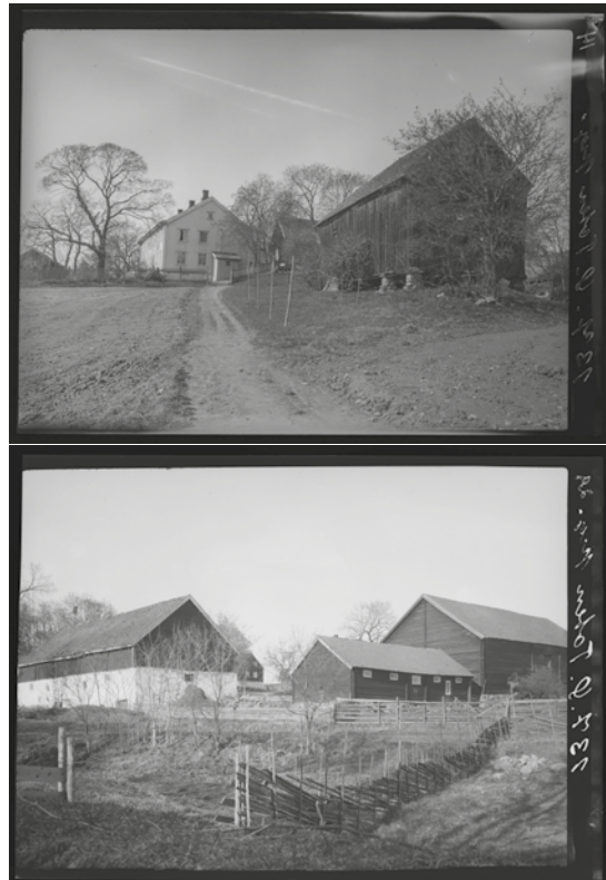
Et par bilder fra boka. Øverst: Bilde av stabburet som i dag står på Stenberg. Nederst: Bilde tatt fra Hoff kirke og viser uttunet.