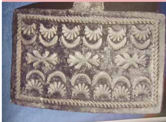
Gorojarn frå Evang - laga på 17-1800-tallet.

Heraf lægges en Skefuld i Jernet, og man seer første Gang, om den skal være mere eller mindre fuld.