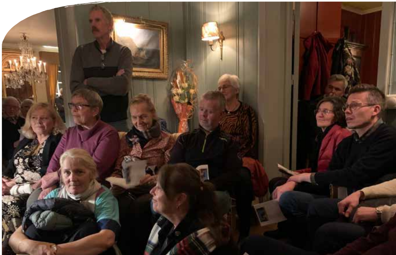
Folk satt tett under boksleppet i prestegården.