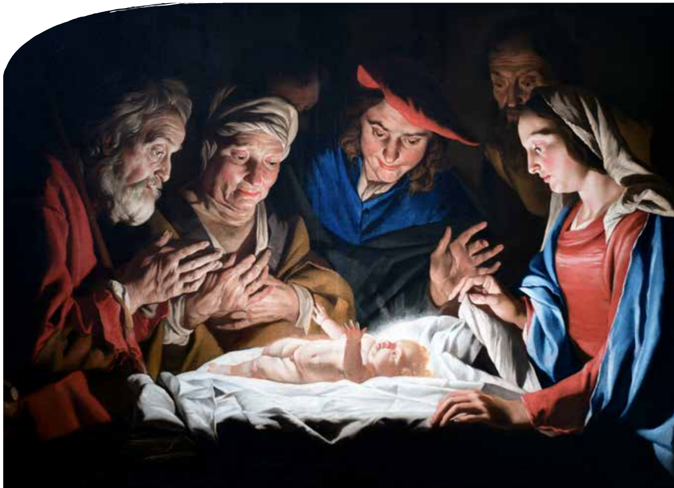
Gjeterne tilber det nyfødte barnet. Matthias Stomer.