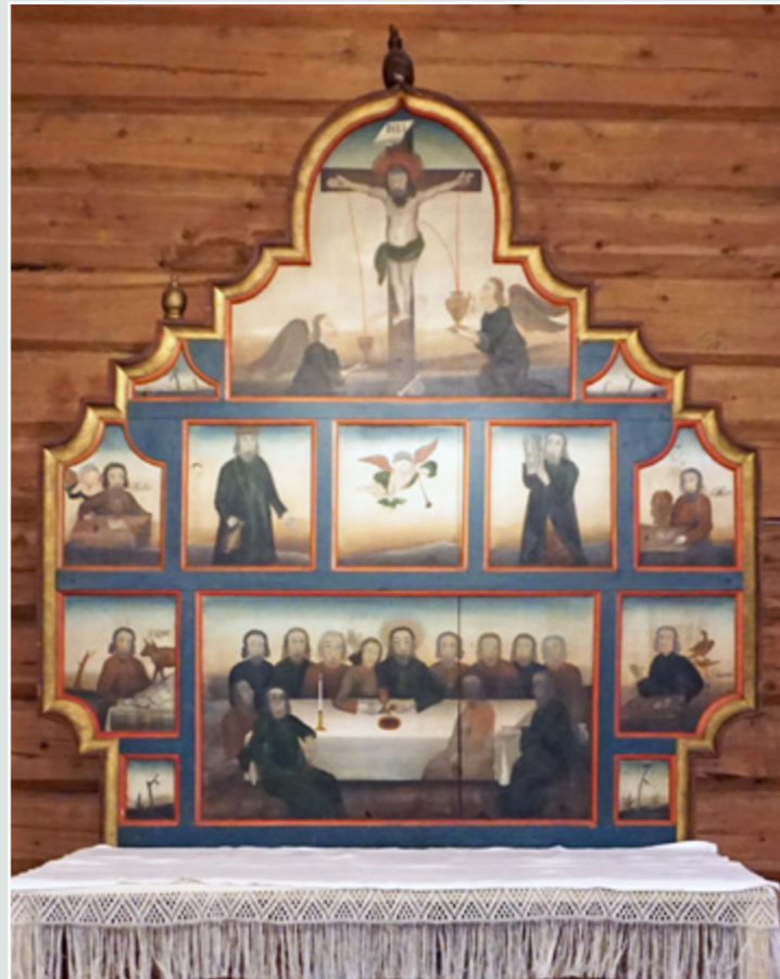
Altartavla i Volbu kyrkje.

Øvst ser vi frå Jesu lidning på korset der hovudet hans er omkransa av ein stråleglorie. To knelende englar samlar blod frå Jesu lidande sår i ein kalk og i ei vinkanne. Ved foten av korset ligg Adams kranium og knoklar. Altartavlar frå denne tida har typisk nok også ei framstilling av Moses med lov-tavlene og broren, presten Aron med røykjelseskaret. Midt mellom dei lyser ein ung engel med basun imot oss. Dei fire evangelistane er også med, ein i kvart felt med kvar sitt symbol. Markus med løva, Matteus med eit menneske med vengjer, Lukas med oksen og Johannes med ein ørn. Det var jo desse fire som fortalde og fortolka historiene for ettertida. Altartavla har også fire små felt med landskapsmotiv der vi ser fleire tre. Ei forgylt kantlist omkransar det heile. Listverket rundt motiva har han måla blått med raude profiler. Elles har