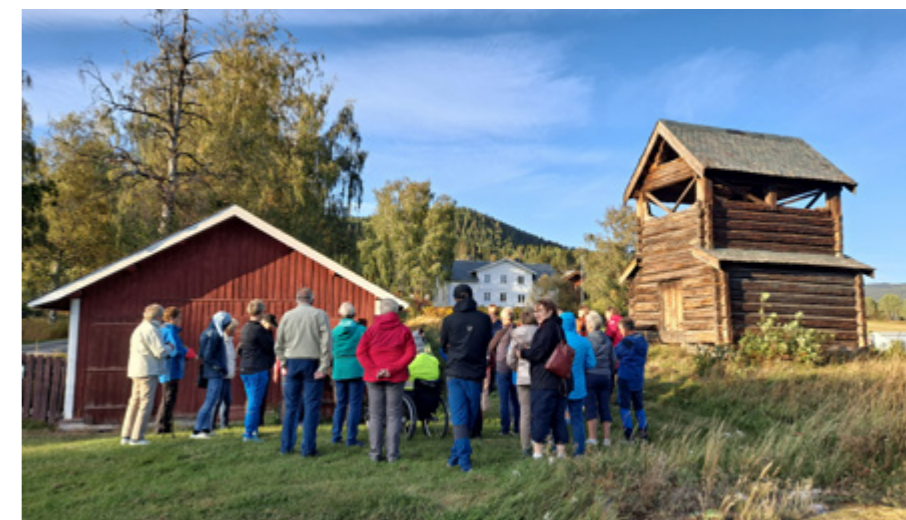
Kommunestallen, bygd i 1846 og den gamle stupulen.

Då det vart bygd kyrkje på Løkji var det ikkje tilfeldig. Dei fyrste kyrkjene vart ofte reist der dei norrøne gudane hadde vorte dyrka. Ei stavkyrkje som truleg vart bygd på 1200-talet vart riven i 1820-åra fordi ho var for lita, og kyrkja som står der i dag er bygd i 1830, årstalet står på kyrkjespiret. I katolsk tid vart stavkyrkja vigd til martyren Blasius og vart kalla Blåskyrkja. I bygdeboka står det at det truleg har stande ei endå eldre stavkyrkje her, då dei fyrste kyrkjene vart reiste like etter kristningstida i år 1000. Ved utgravinga av kyrkjegolviet i 1969 vart det funne myntar frå Håkon Håkonssons tid – og forskjellige materiell tilhøyrande den gamle stavkyrkja, noko låg og i kommunestallen. Dette vart teke vare på, og det vart laga eit Stavkyrkjemuseum i samband med