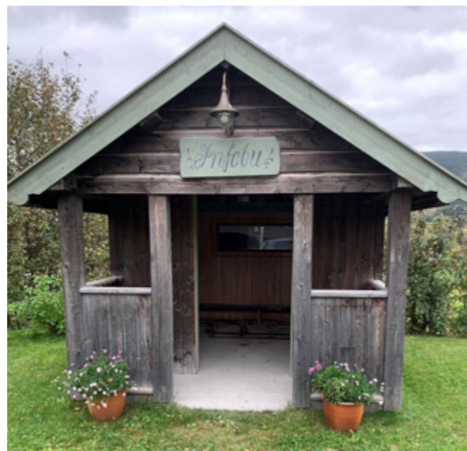
Infobua på Tørget, sjølve midtpunktet og møteplassen i bygda. Bilete øvst på sida viser taket i infobua.

har det verkeleg fått liv att med ei flott Infobua med kart over Volbu med heimstølar og fjell og historikk. Kvar 1. sundag i advent blir julegrana tent her m.a.