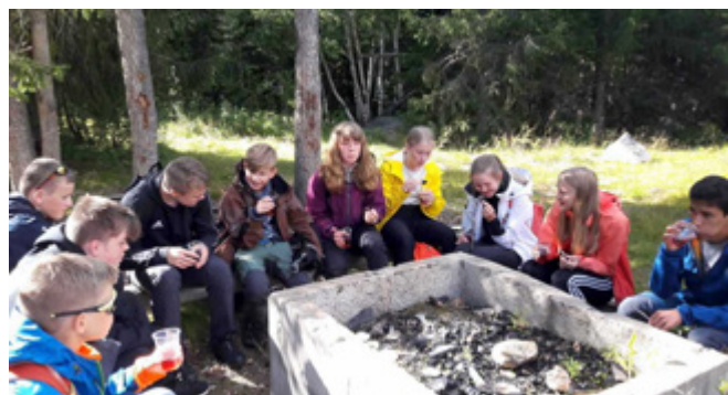
Vi samlast ved Gapahuken til øving på nattverd.