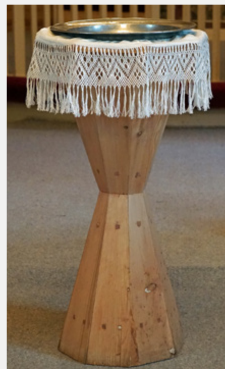
Døypefont i Volbu Kyrkje.