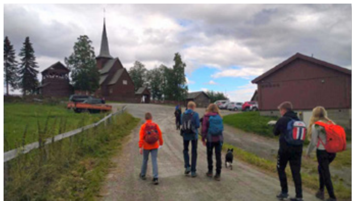
Endeleg målet i sikte, Hegge kyrkje.