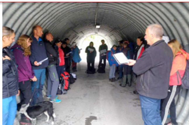
Alltid lys i tunellen, og vi sang "Deg være ære."