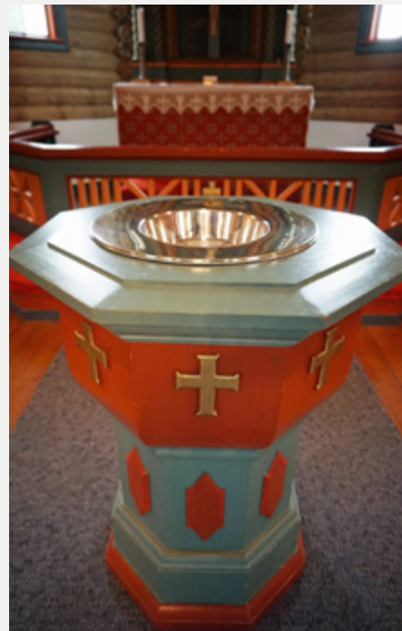
Døypefont i Lidar Kyrkje.