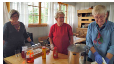
Som alltid, bygdekvinne tok imot med prima traktering, så vi kjente oss mest borskjemt for å sitere ein konfirmant!