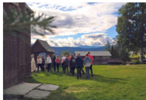
Pilegrimane på veg inn til gudstenesta i Hegge kyrkje.