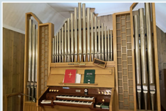
Fasade orgelet i Volbu kyrkje.

Volbu kyrkje har som Lidar og Hegge, eit orgel som er produsert av Norsk orgel og Harmoniumfabrikk i Snerthingdal. Orgelet i Volbu vart bygt i 1962 og har 9 stemmer: rørfløyte 8', principal 4' og oktav 2' i I manual; gedakt 8', rørfløyte 4', principal 2' og kvint 2 2/3 i II manual og subbas 16' i pedal. Før dette hadde kyrkja eit orgel med 5 stemmer og eit manual