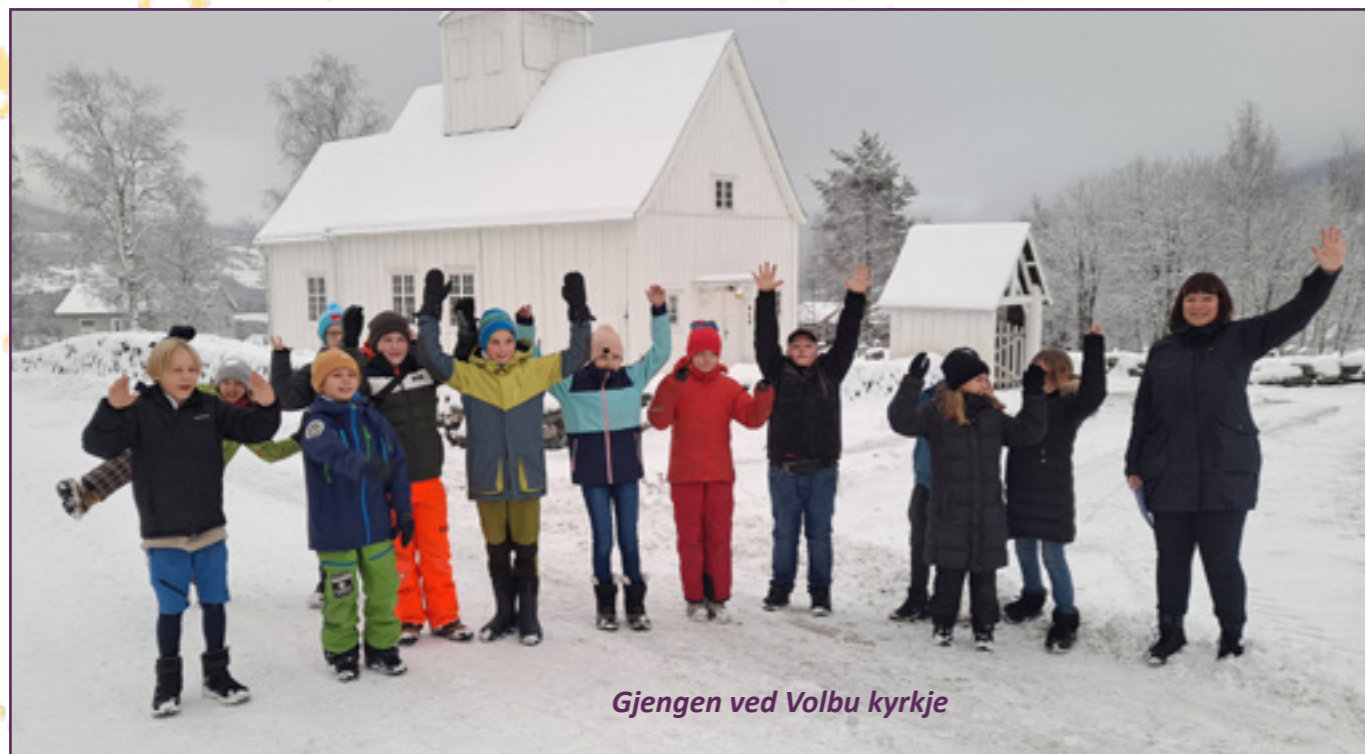
Gjengen ved Volbu kyrkje

Freitag 25. november var ein flott gjeng 6. klassingar med på Lys Vaken i Volbu. Vi hadde god hjelp av både konfirmantar og stab, og det vart ein innhaldsrik og veldig hyggeleg dag!