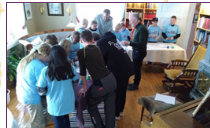
Øving av julesongar på handklokkespel