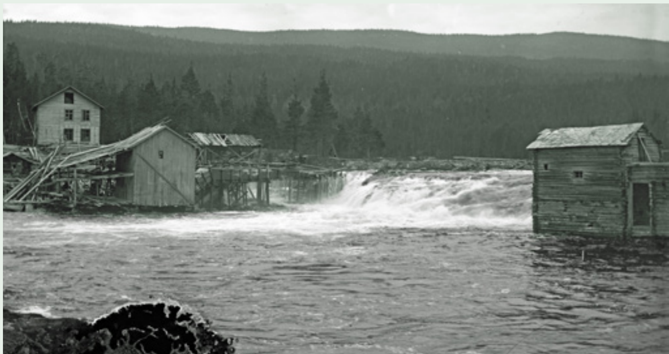
Industri rundt Høvsfossen rundt 1900.