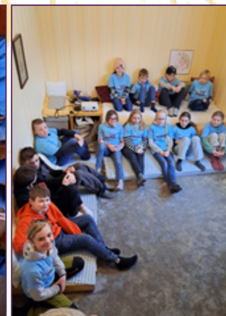
Klare for film!