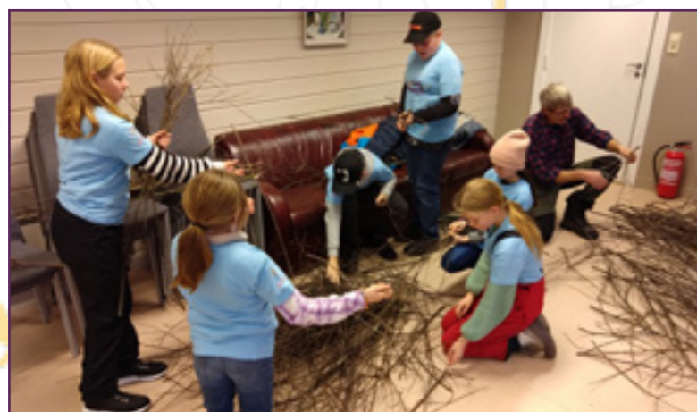
Produksjon av sopelimar