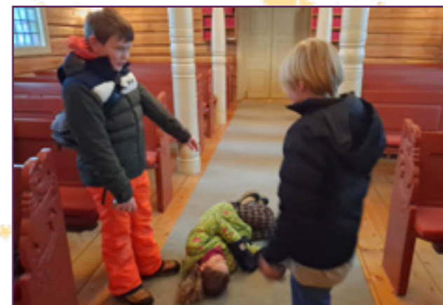
Den barmhjertige samaritan i aksjon