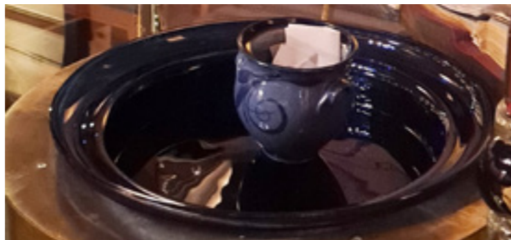
Bønekrukke i Lyskappellet.

Kva i all verda er det som gjer at folk kan stå i timevis med fiskestanga ute i eit fjellvatn? Naturen, freden, men og spenninga og håpet! Håpet i det hengande snøret!