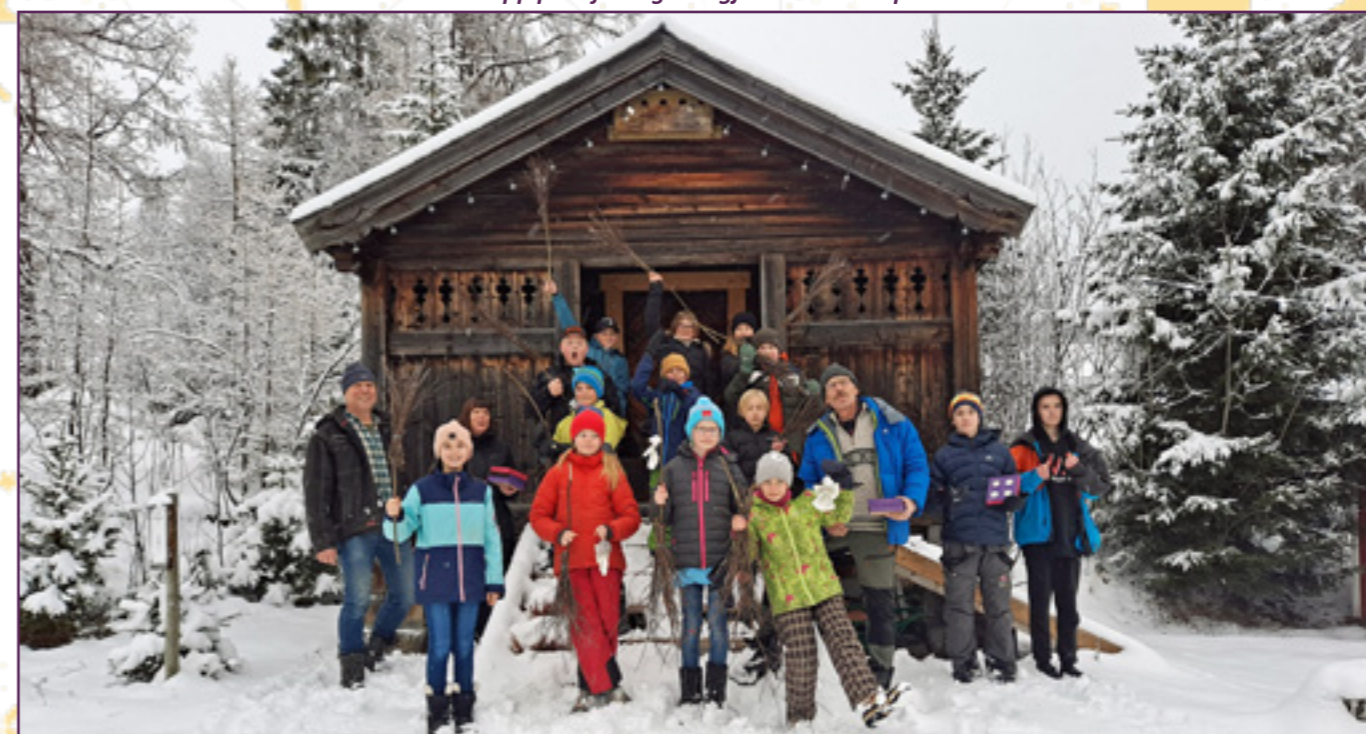
Moro med Lys Vaken!