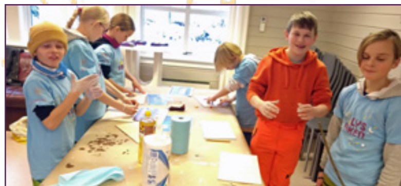
Litt kliss høyrer med når ein skal lage puslespel med ulike motiv frå alle kyrkjene