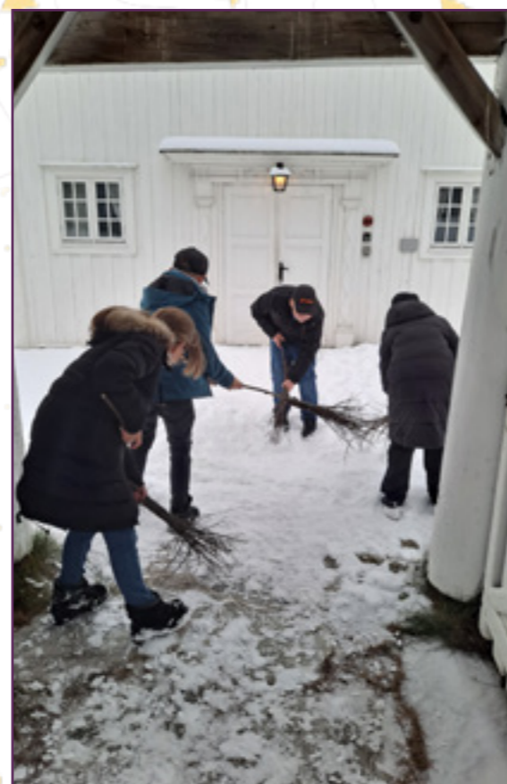
«Rydd vei for Herrens komme»