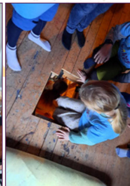
For å kome til filmrommet måtte vi både opp på loftet og ned gjennom eit skåp