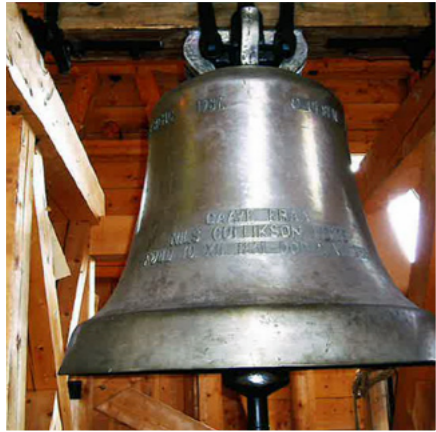
«Den største kyrkjeklokka i Valdres»