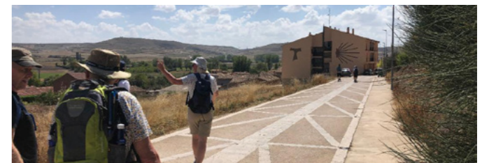
Vi vandrar mot Castrojeriz i Leon

Opplevingane hadde stått i kø og inntrykka pakka seg over kvarandre. Den siste dagen tok vi bussen til Porto, ein av dei næraste flyplassene. Vi fekk nokre ettermiddagstimar og kvelden der. Då var begeret fullt og vi berre registrerte at dette var nok ein interessant by rundt munningen av elva Douro som vi gjerne ville koma tilbake til.