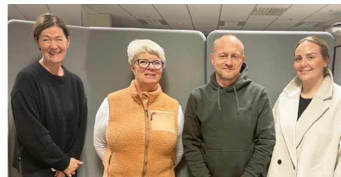
Delar av det nye soknerådet i Lidar