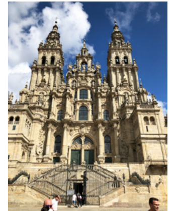
Den imponerende fasaden av katedralen