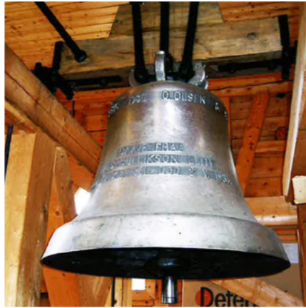
«Fred paa jorda». Det ynskjer vi i dag òg