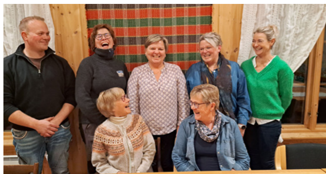
Det nye soknerådet i Rogne