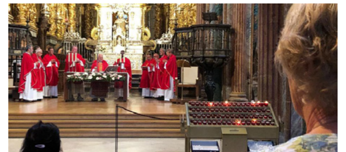
Messe i Santiago de Compostela. Vi hadde orkesterplass