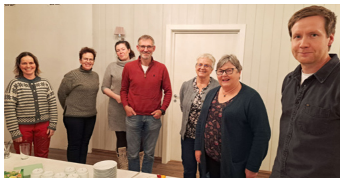
Det nye soknerådet i Volbu saman med avtroppande leiar