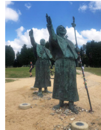
3 m høge stauar av pilegrimar som endeleg ser tårna til katedralen i Santiago