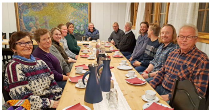
Det gamle og nye soknerådet i Hegge