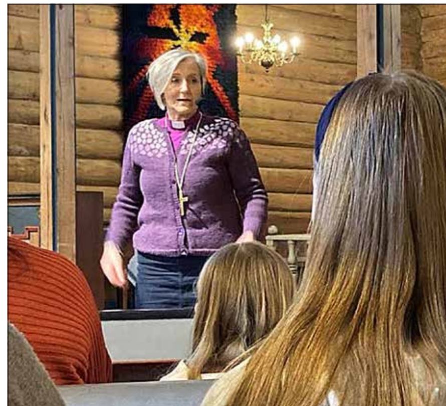
Biskopen møter skolebarn på Voll.