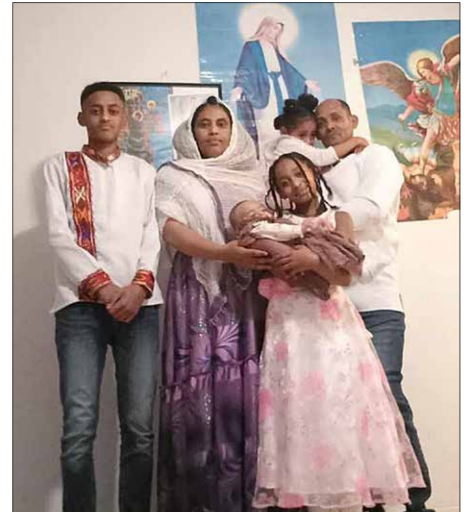
Feven med familien.

Før påskedagsfeiringa har barna gjerne fått noen nye klær. Alle, særlig kvinnene, forbereder seg ved å pynte hår og negler, ordne klær, hus og mat. Alt må være klart før feiringa. Så starter vi i kirka kl 20 påskeaften med gudstjeneste. Den varer til kl 4 påskemorgen. Alle har tente lys. Vi hører Guds ord og synger lovsanger. Men barna og en del voksne går gjerne heim ca kl. 22. De som er igjen, feirer messe videre utover natta. Det er veldig mye sang. Noen går til nattverd, men der er reglene forskjellige.