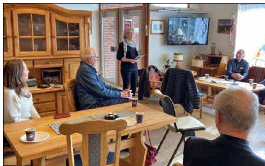
Samling på Grendabua på Innset.