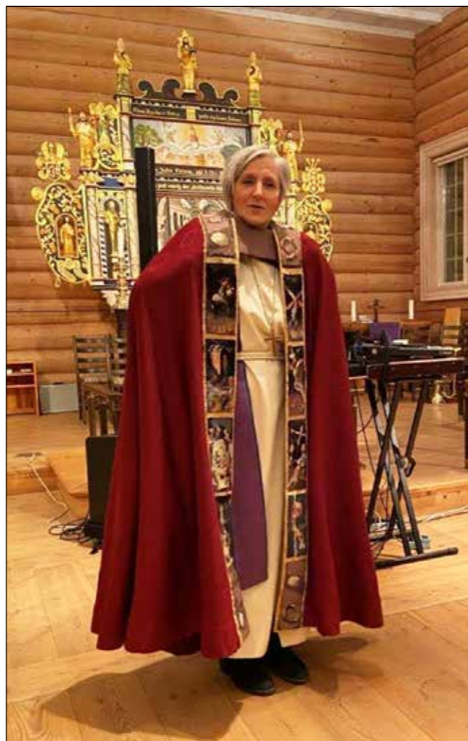
Biskopen med hele festdrakten i kirka på Innset.