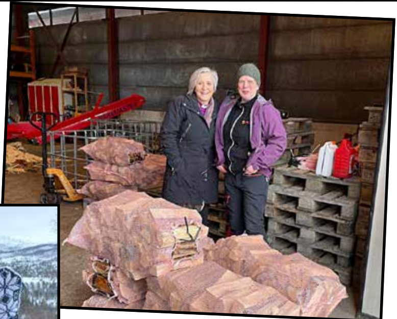
På besøk ved Vedsentralen.