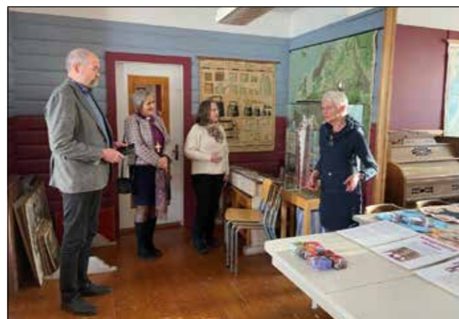
Besøk i lokalane til Innset Husflidslag.