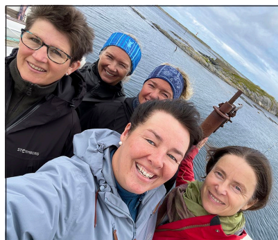
På tur med venninner fra Rennebu: