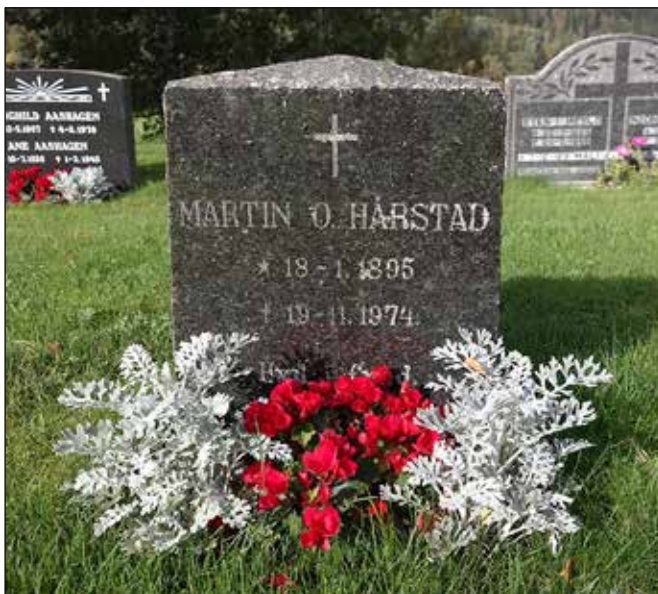
Fin beplantning rundt grava

Gravminner som fjernes må følge regelverket. Gravminnet trenger ikke knuses, men navn må slipes bort. Det skal ikke kunne være gjenkjennbart. Det kan heller ikke brukes til å lage privat minnesteid i egen hage eller lignende. Ut over det er det ingen begrensninger.