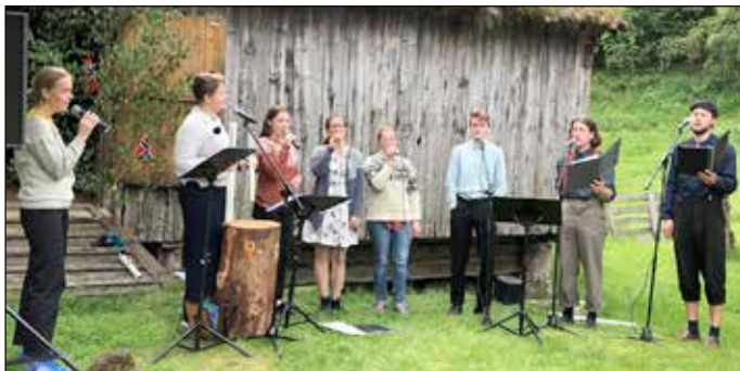
St. Michaelis sang vakkert på Bygdetundagen på Haugen

Så hva nå? Alt vi har fått oppleve dette fantastiske året er noe vi må bygge videre på i menigheten og i kirka i Rennebu. Det gjelder nå å utnytte momentum som det heter – å la lyset fra jubileet skinne i fortsettelsen! Vi har fått nye menighetsråd i bygda og mange nye medarbeidere der. Utfordringen går både til dem og andre frivillige krefter. Nå skal vi bygge videre, dag for dag. Det blir for lenge å vente til neste jubileum.