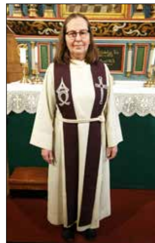
Violett stola-kors og alfa og omega