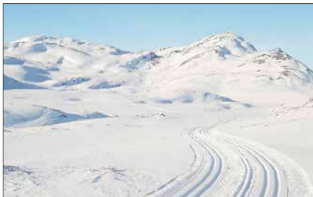
Flott løypenett, god verdiskaping i bygda vår.

- Mange er glade for å få levert ting de ikke har bruk for og at det dermed kan komme andre til nytte. Så er det også mange som er glade for å kjøpe ting billig og samtidig støtte gode formål. Alt som kommer inn av varer er gratis for butikken og alle arbeider gratis.