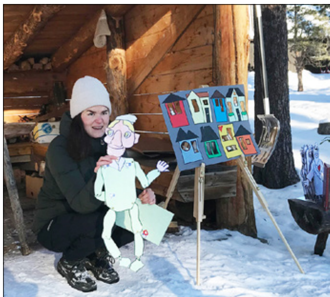
Elisabeth fra Acta (Normisjons arbeid blant barn og

Der tente vi bål og koste oss med medbragt grillmat, sang og skileik. Coronatida har lært oss å tenke kreativt for å kunne samles på trygge måter. Mange av oss kjenner på et savn av fellesskap med hverandre, og det er godt og viktig å kunne møtes om det som betyr mest, nemlig Jesus. Mjuklia er en perle som det alltid er koselig å komme til, og været var flott, -5 gr og strålende sol.