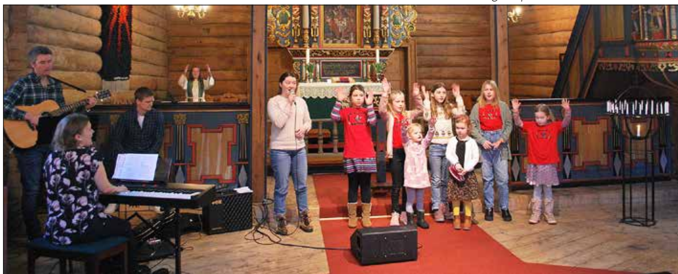
Et sterkt redusert Rennebu Soul Children bidro med sang. 2/3 av koret var borte på grunn av koronasmitte.