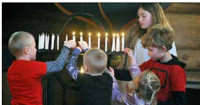
Barna var med på lystenning under forbønnen.