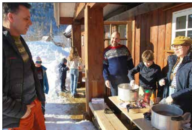
Servering av pølser til alle i Hurundstuggu etter gudstjenesten.