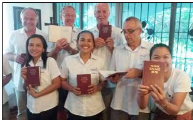
Glade og takknemlige medarbeidere med salmebøker fra Innset

Ellers er sjømannskirka kjent for sine gode vafler og