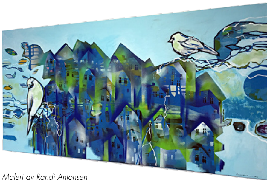
Maleri av Randi Antonsen - utstiller på årets martna.

Det er kanskje noe å ta med seg når en går inn i et nytt semester?