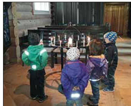
4-åringene på besøk i Innset kirke