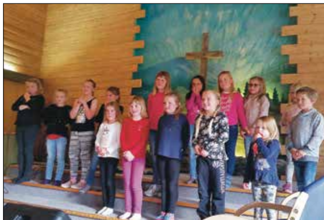
Rennebu Soul Children

Lørdag var det opp til frokost kl 8. Etter en del øving av nye sanger med tema nestekjærighet, var det godt med lunsj før utetid og lek. Leiren ble avslutta med middag og flott minikonsert for foreldre og besteforeldre kl 16. Koret teller nå ca 20 deltakere som lærer sanger i rekordfart og synger av hjertens lyst. Alle så ut til å sette pris på de gode opplevelsene og fellesskapet som et slikt leirdøgn gir.