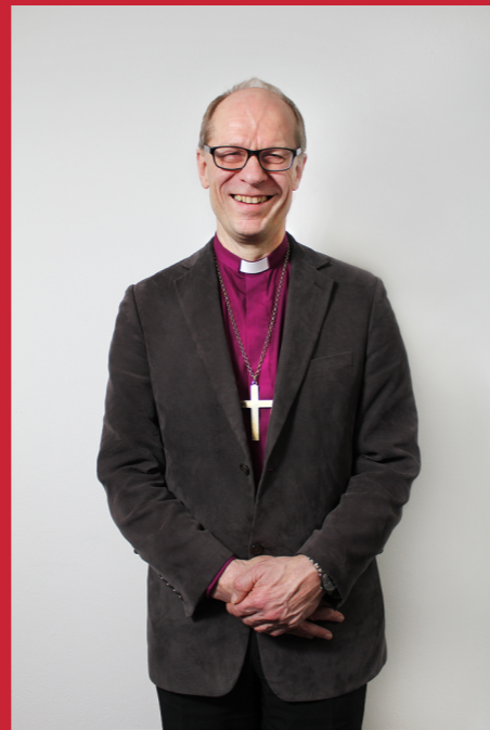
Biskop Olav Øygard