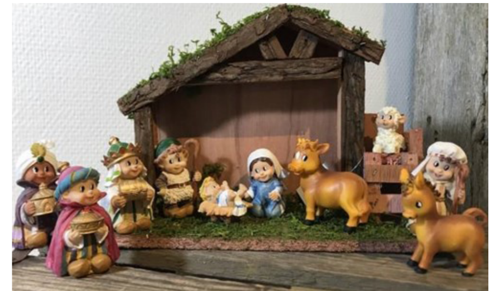
Denne varianten mente 4-åringene var alt for barnslig, og figurene hadde rare øyne!