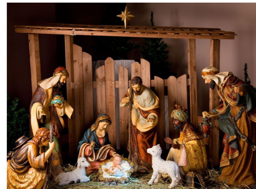
Bilde nr 2:

Dette er krybbevarianten som fikk flest stemmer i ekspertpanelet. Den fineste figuren er kongen til venstre, med den blå gaven, det var enighet om at den inneholdt godteri. Kongen til høyre er også godt likt, merk at han har en fugl på hodet! Det var litt diskusjon om hvem barnet var, noen mente Jesus, andre var ikke helt enige. Mora til barnet er ei prinsesse.