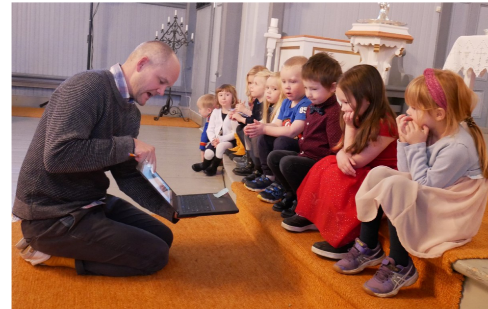
Dyp konsentrasjon rundt gjennomgangen av forskjellige krybbe-varianter.