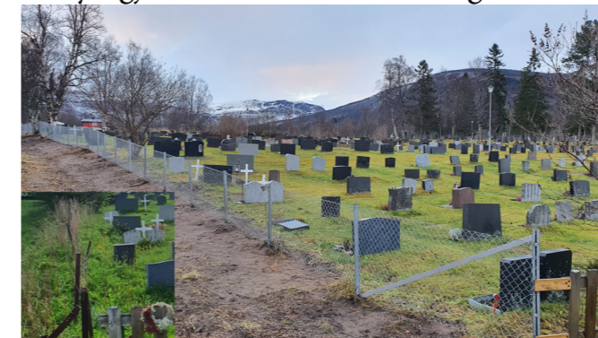
Flott nytt gjerde er satt opp (innfelt gammelt gjerde)

Det gamle forfalte gjerde er endelig erstattet av nytt gjerde. Resultatet ble veldig bra.