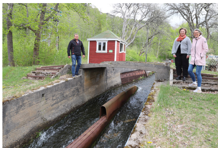
Tømmertunnelen representerer en spennende epoke i lokalhistorien, og de frammøtte vil få en liten presentasjon under samlingen.

hele 300.000 tømmerstokker i uka. En meget spennende epoke i lokalhistorien det er verdt å høre om.