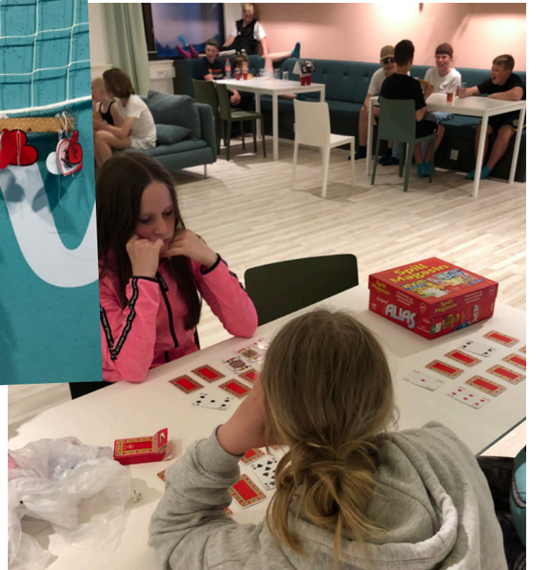
Det var god tid til både fysiske aktiviteter og «henging» med spill denne kvelden på Sjev.