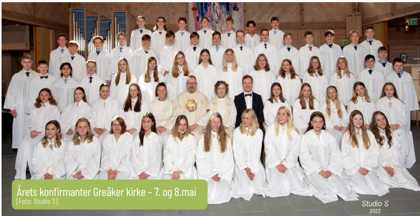
Årets konfirmanter Greåker kirke - 7. og 8. mai