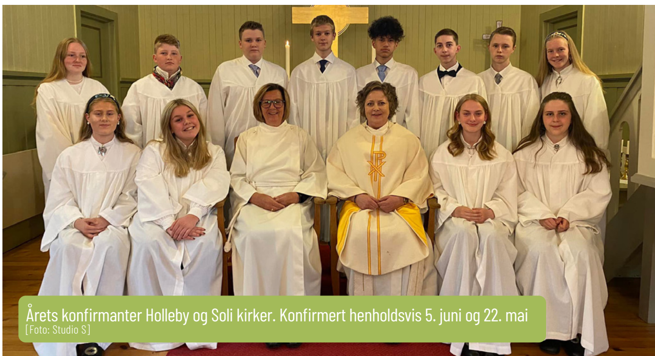
Årets konfirmanter Holleby og Soli kirker. Konfirmert henholdsvis 5. juni og 22. mai