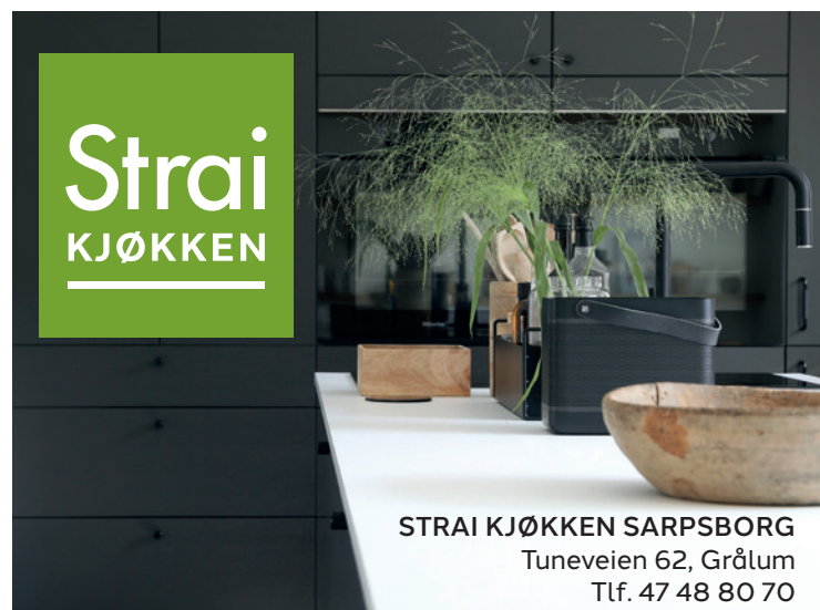
STRAI KJØKKEN SARPSBORG Tuneveien 62, Grålum Tlf. 47 48 80 70

GREÅKER:.....13243 HOLLEBY:.....115437 SOLI:.....72337 TUNE:.....13167 SARPSBORG:.....50235