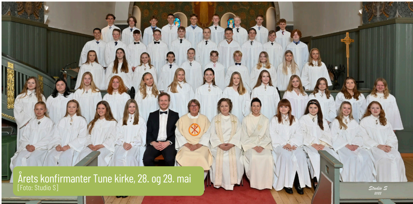
Årets konfirmanter Tune kirke, 28. og 29. mai