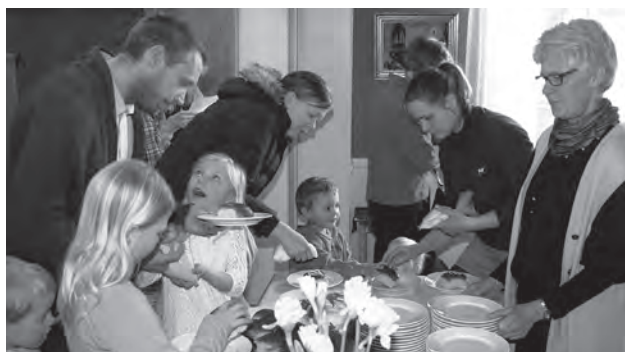
Etter Gudstjenesten vanket det kaffe, saft og påskeboller som fikk bein å gå på...