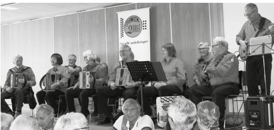
Svingen 2Rader sto som vanlig for go'fot-musikken!