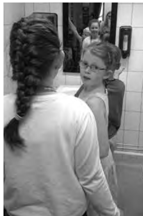
God håndhygiene er viktig - og det er slett ikke så ille å stå i kø