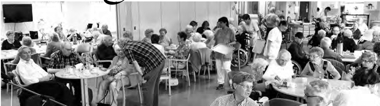
Frammøtet var formidabelt denne dagen.

Den første torsdagen i hver måned trommer Haugvolls nye venner sammen til fest for beboerne med pårørende og venner. Ett lite unntak var Sankthans aften på tirsdag. Da ble det selvsagt grøttest med godt drikke til, gode vitser, loddsalg, musikk og kaffe og kaker - ikke rart go'praten gikk rundt velfylte bord. Oppslutningen var rett og slett formidabel denne Sankthansdagen hvor selv været viste godsiden til.