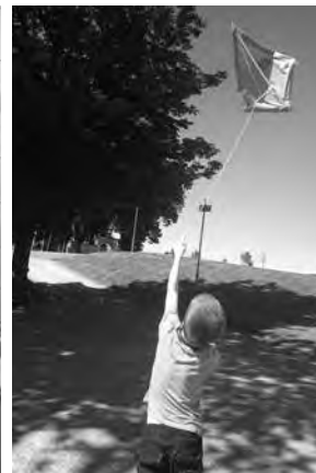
Audin sin drage flyr

Selv om ferieklubb i Hafslund kirke ble gjennomført for første gang 1. og 2. juli denne sommeren er det ikke et nytt konsept. Ideen bygger på en lang tradisjon med bo hjemme leir på Stenbekk misjonscenter like før skolestart. Nå ønsket menighetspedagog