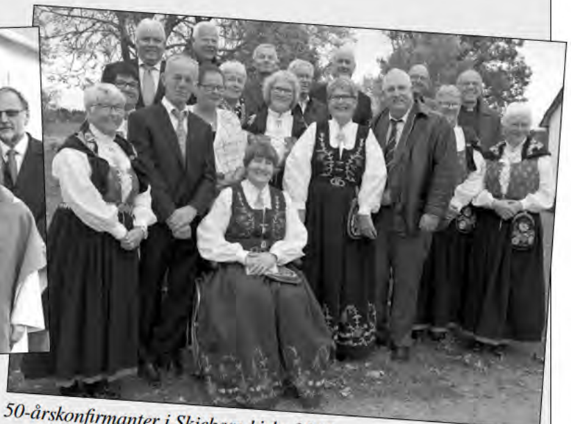
50-årskonfirmanter i Skjeberg kirke 2016.