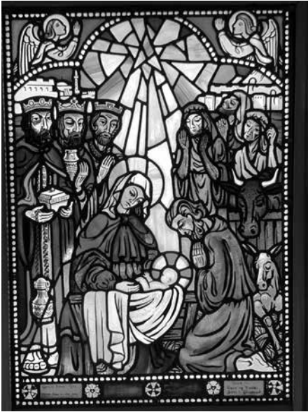
Alterbilde i Mangen kapell, Aurskog-Høland.

Jeg vokste opp under den kalde krigens kaldeste periode. Vi lærte å bruke tilfluktsrom. Fra klassevinduene så vi Nike-raketten på Rustan i Asker, de var en del av Nikebataljonen som også hadde batterier i Nes, Trøgstad og Våler, alle i Borg bispedømme. I avisene leste vi om prøvesprengninger i nord og Stillehavet i sør, og om muligheten for atomkrig. Sammen med våre foreldres fortellinger om nazistenes okkupasjon av Norge 1940-45 var krigens mulighet i Norge en del av vår livsfølelse.