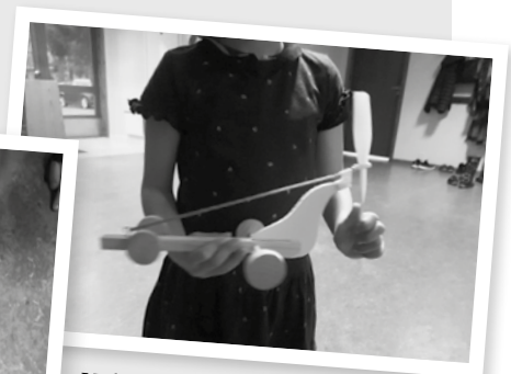
Vi har lagd strikkmotorbil

Strikkmotorbil race, ivrige bileiere på gulvet