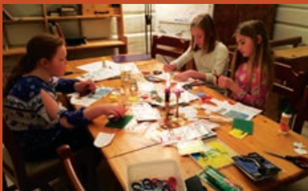
Adventstund på Selsverket