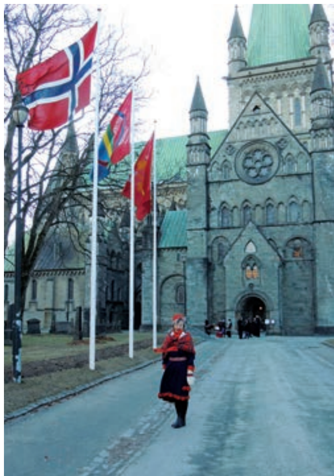
Også det samiske flagget vaiet i vinden utenfor Nidarosdomen

Ábččámet, don gubte leat almmis! Basubuvvos du namma. Bohtos du riika. Šaddos du dábtu, mo almmis nu maiddái eatnama alde. Atte midjiide odne min beaivválaš láibbi. Atte midjiide min suttuid ándagassii, nugo mii ge ándagassii addit velggolaččaidasamet. Ale doalvo min geahččalussii, muhto beastte min babás eret. Dasgo du lea riika ja fápmu ja gudni agálašvubtii. Amen.