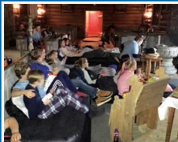
Tekst og bilde: Randi Bakken Vassplassen

Fra Lys våken i Sel kirke første helga i advent. Barn opplever kirka som et sted å være våken for livet rundt seg og for Gud. Lys våken er et årlig arrangement med god oppslutning av 12 åringer i fint samspill med ungdomsledere. Vi hadde stort fokus på sang, lek og øving til søndagens Lys våken gudstjeneste. Dette resulterte blant annet i en liten «musikal» med Kristuskransen som tema. Super helg med barn og ungdommer!