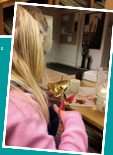
Tekst og bilde: Randi Bakken Vassplassen

Bilde fra «Kreativ aften» i Bykirka i november. Her lagde vi rekvisitter til julevandring og diverse julepynt.