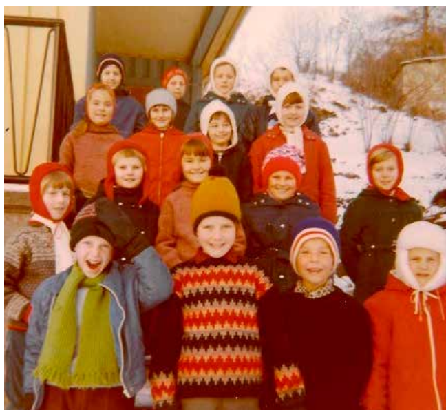
En glad gjeng på søndagsskole i Brekka.

I Buvika var det søndagsskole flere steder, på Havenget og Ilhaugen, samt i øvre Buvika. Mamma hadde i flere år hjelp av medarbeidere, enten nabo, menighets-sekretær, og ikke minst noen ivrige ungdommer i nabolaget. Etter at søndags-skolen flyttet til heimen i Brekka, ble pappa en viktig medspiller, og uten han ville det blitt for mye arbeid å holde aktiviteten i «det gule huset» i gang. Han var opprinnelig smed, laget nye lykter til inngangsstolpene