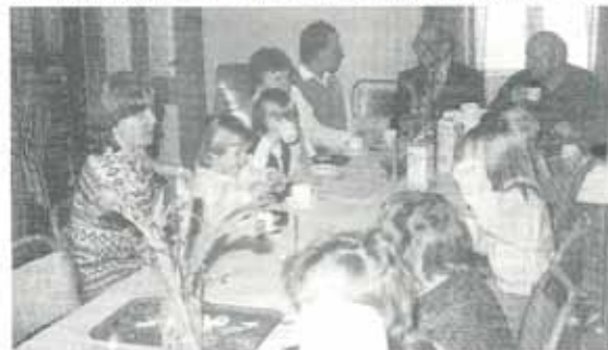
Ungø og eldre i hyggelig selskap.