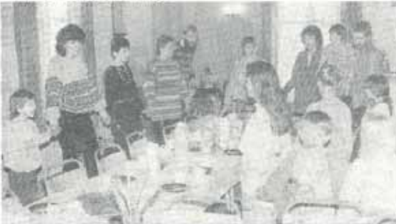
Frokosten ble avsluttet med "Vi tar hverandres hender".