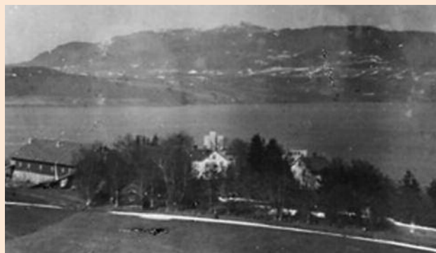
Vegen i Hammerslia. I bakgrunnen Hammer frammgard med den vakre låna frå 1857.