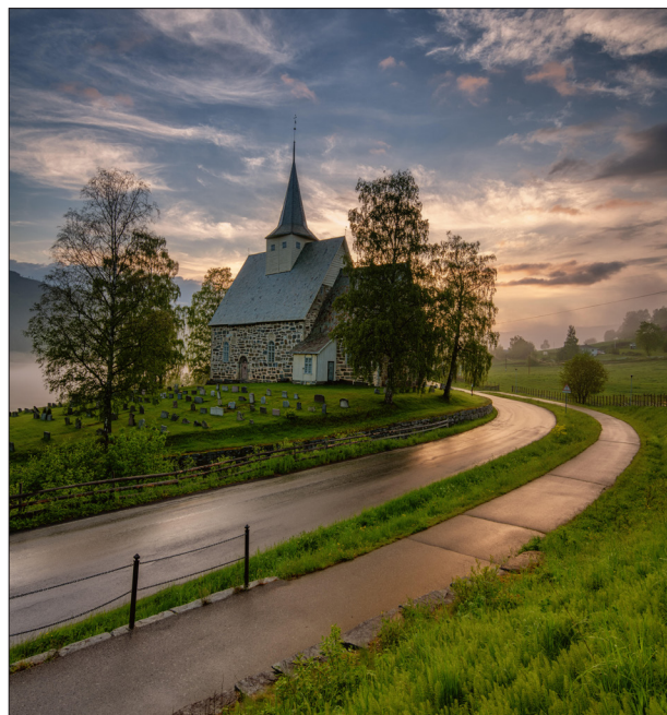
Slidredomen blir en flott plass for jubileum og fredsgudstjeneste den 29. juli 2023.