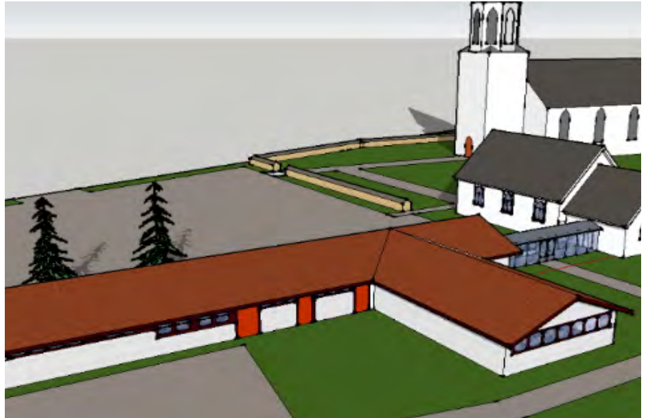
Tilbygget sammen med eksisterende bygninger sett mot nord-øst.

Romedal menighetsråd har tidligere (i Menighetsblad nr. 3 og 4 i 2017) informert om at vi arbeider med å få realisert et kirkesenter i Romedal. Vi innser at begrepet kirkesenter egentlig er noe misvisende. Vi har allerede i dag et kirkesenter med kirke, kapell og driftsbygning. Det vi arbeider for nå, er et tilbygg til driftsbygningen for å få mer egnede lokaler til menighetens virksomhet. Vi trenger først og fremst flere og bedre lokaler for lettere kunne gjennomføre den lovpålagte trosopplæringen som vi har informert om tidligere. I tilbygget planlegger vi 2 mindre aktivitetsrom til trosopplæringstiltak, konfirmantundervisning, mindre møter, korvirksomhet osv. Salen i kapellet vil fortsatt være menighetens «storstue» og vil fortsatt bli brukt til kirkekafe, kulturkvelder, salmekvelder og andre litt større arrangementer. I tilbygget planlegger vi også 3 kontorer for å kunne samlokalisere arbeidsplassene for prest, organist, menighetsråd, menighetspedagog og frivillige. Det lille «kontoret» ved siden av nåværende kjøkken kan da frigjøres og innlemmes i kjøkkenet som samtidig vil