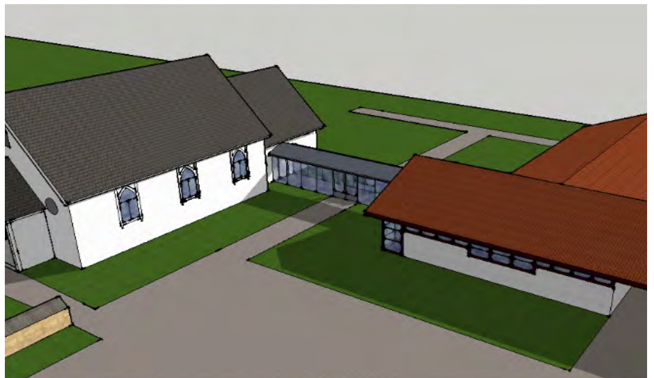
Tilbygget og kapellet sett mot syd-øst.