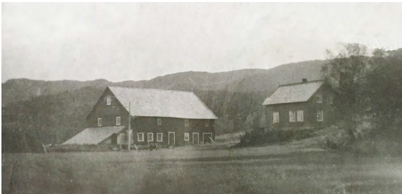
Dette bildet viser hjemlassen Losvar før det ble brent ned av tyskerne.