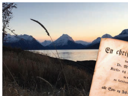
Godt og tjenelig vær.