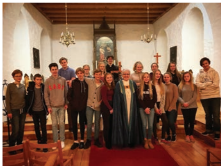
Biskop med konfirmanter i Steigen kirke.