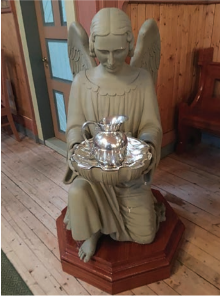
Døpefonten i Leiranger kirke.

tasforedrag og oppsummerte sine erfaringer gjennom uken. Foredraget vil bli tilgjengelig for gjennomlesing på Sør-Hålogaland bispedømme sine hjemmesider.