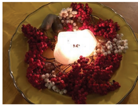
Bordpynt på Skagstad gård.