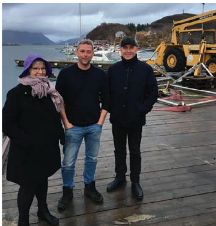
Bedriftsbesøk på Slipen.