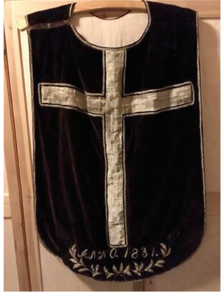
Gammel messehagel fra 1831 i Steigen kirke.