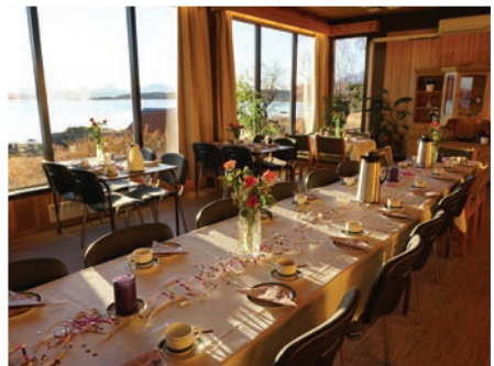
Bordet er dekket... kirkekaffe etter visitasgudstjenesten.