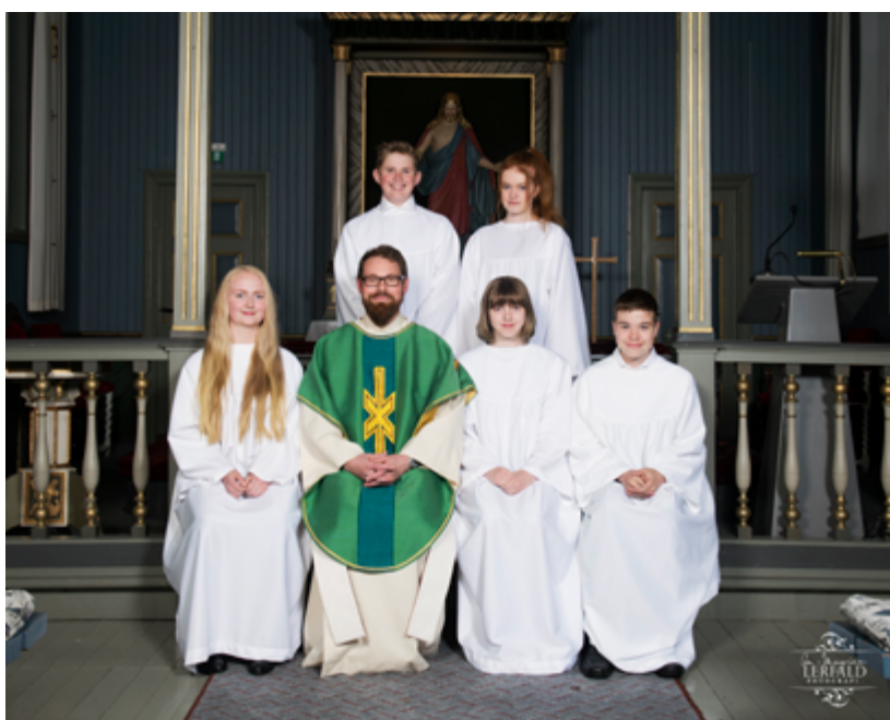
Floren kapell 2. juni 2019