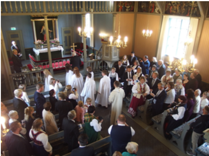
En fullsatt kirke på den store dagen