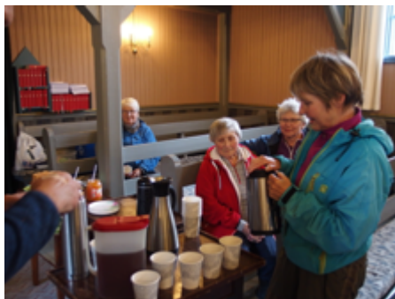
Floren Sanitetsforening sto for serveringa

Vi i Hegra menighetsråd takker alle som deltok på kveldene for en flott innsats. En ekstra stor takk til lag og foreninger som stilte med servering på alle kveldene.