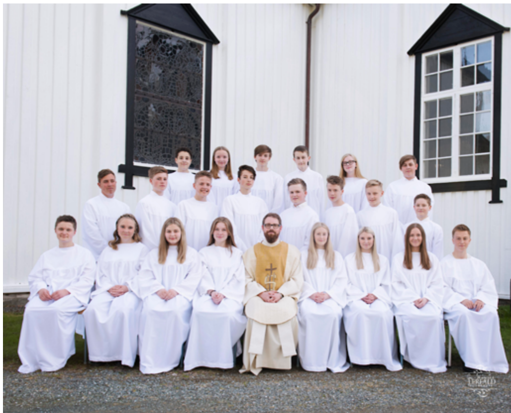
Hegra kirke 19. mai 2019