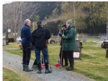
Planlegging må til ved dugnadsarbeid. Her fra kirkegården i Floren