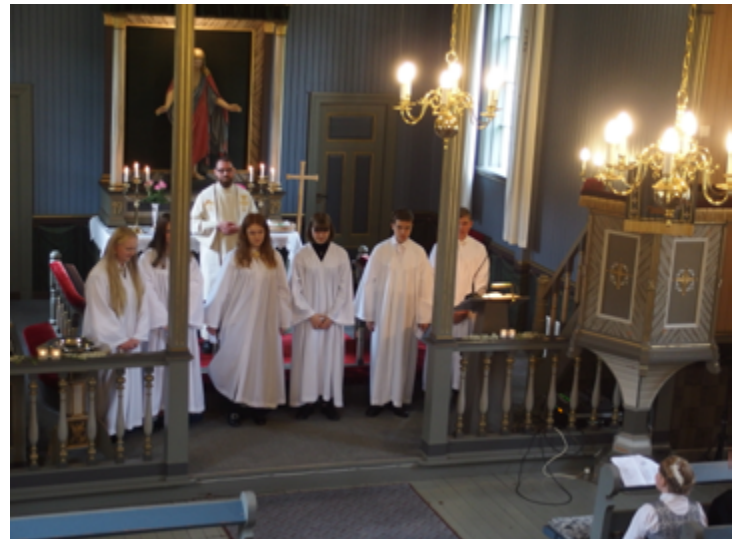
En flott bukett ungdommer ble konfirmert i Floren kapell 2. juni